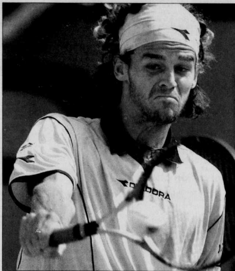
Le Brésilien Gustavo Kuerten est venu à bout de Carlos Ferrero en cinq sets, 7-5, 4-6, 2-6, 6-4 et 6-3.

Il ne lui faut que deux ou trois coups pour marquer le point. Il chatouille les lignes, il dépoussière les angles du court, il transperce Kuerten quand celui-ci s'aventure au filet. Il le prend réguli-