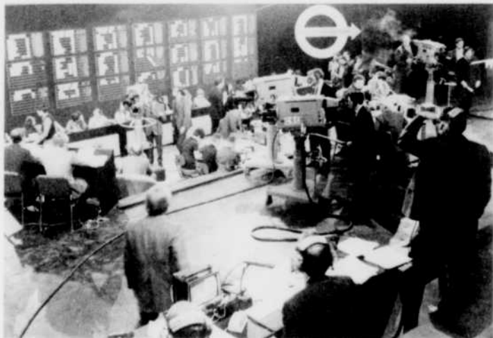
La toute première production de CBAFT: une soirée d'élections au Nouveau-Brunswick.

— «Au cours des années, nous avons présenté quelques émissions spéciales, pas très