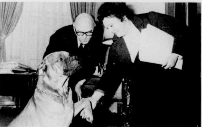
Devant les maires, il faut savoir montrer patte blanche...