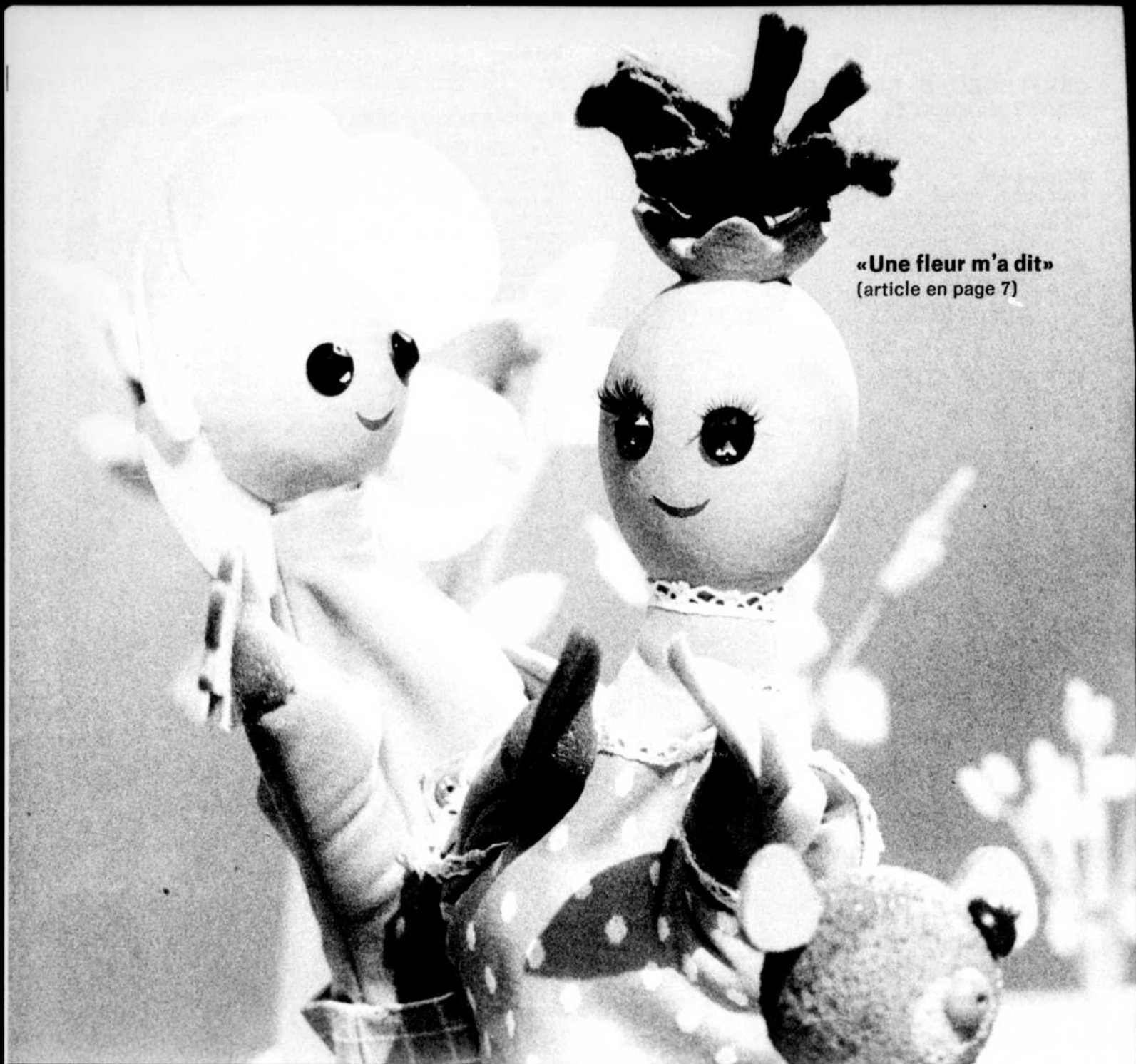
«Une fleur m'a dit» (article en page 7)

POUR NOUS ÉCRIRE AU SUJET DE VOTRE ABONNEMENT Changement d'adresse, facturation, réclamation ou réabonnement, adressez votre correspondance à