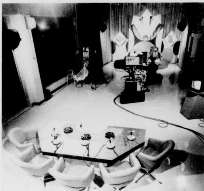
Le studio de télévision d'où sont diffusées les nouvelles régionales, les nouvelles du sport et l'émission «Les Maritimes aujourd'hui».

...CBAFT, Moncton, et CBGAT, Matane, se «disputent» l'antenne de la station affiliée de Carleton qui diffuse les informations régionales des deux stations de Radio-Canada à l'intention, dans le premier cas, des téléspectateurs du nord-est du Nouveau-Brunswick et, dans le second cas, de ceux de la Gaspésie.