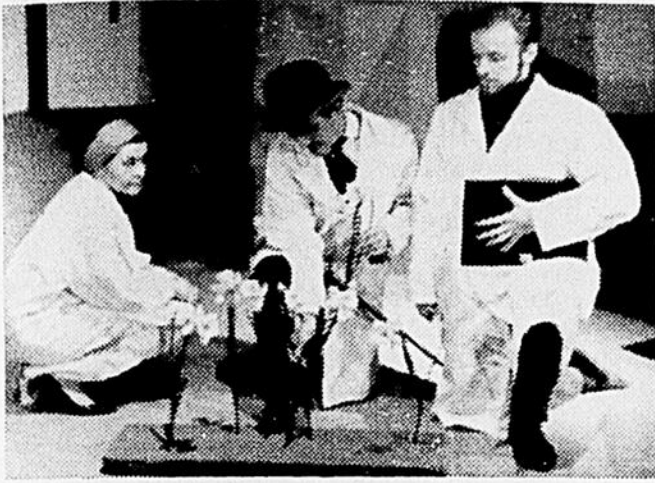
"QUI EST DUPRESSIN ?"

Depuis une quinzaine d'années le théâtre a pris de l'ampleur à Montréal; des troupes de théâtre se sont formées et quelques-unes se sont taillé une place importante. Il y a donc au théâtre un regain de vitalité, mais à côté de cet aspect qui peut sembler optimiste, il faut noter un manque de public et surtout d'un public étudiant et ouvrier. Les directeurs de troupes se voient dans l'obligation de donner au public ce qui lui plaît (prolifération de pièces de boulevard ou du déjà vu) pour pouvoir combler des déficits ou tout simplement pour pouvoir vivre. On pourrait discuter longuement pour savoir si