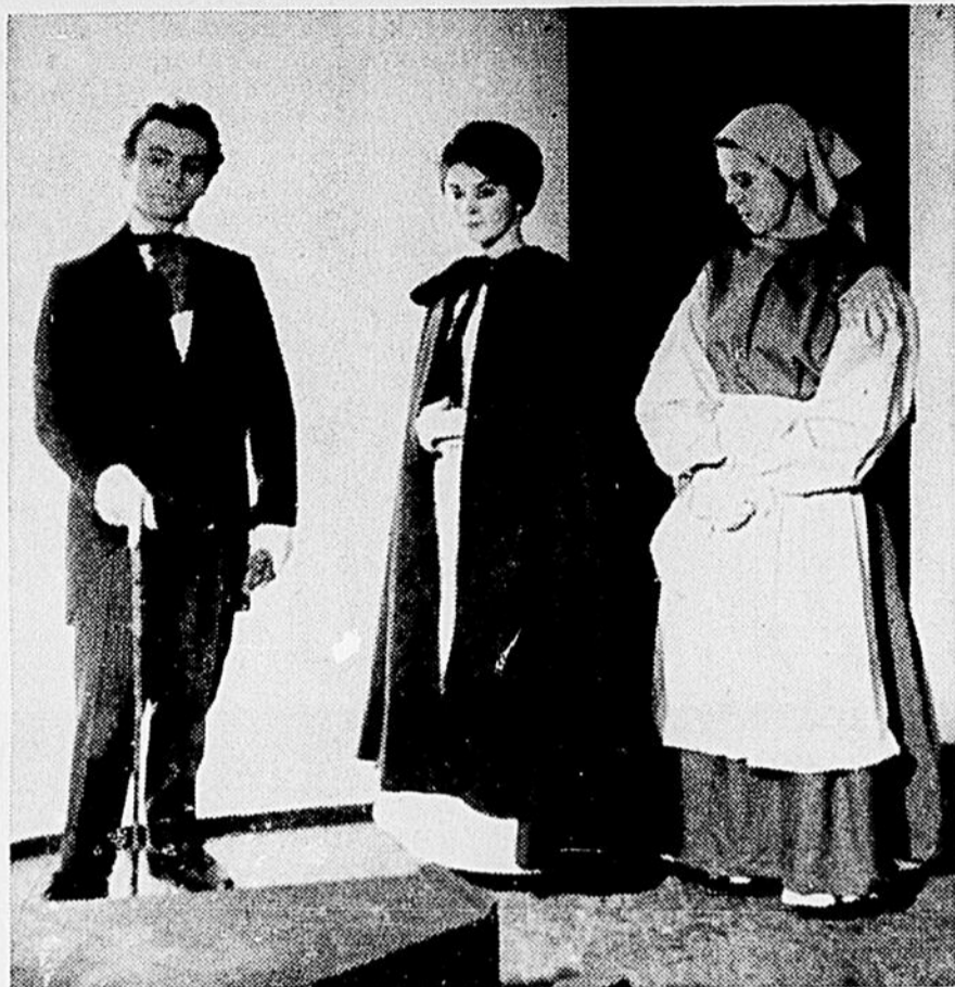
"LA FEMME DOUCE"