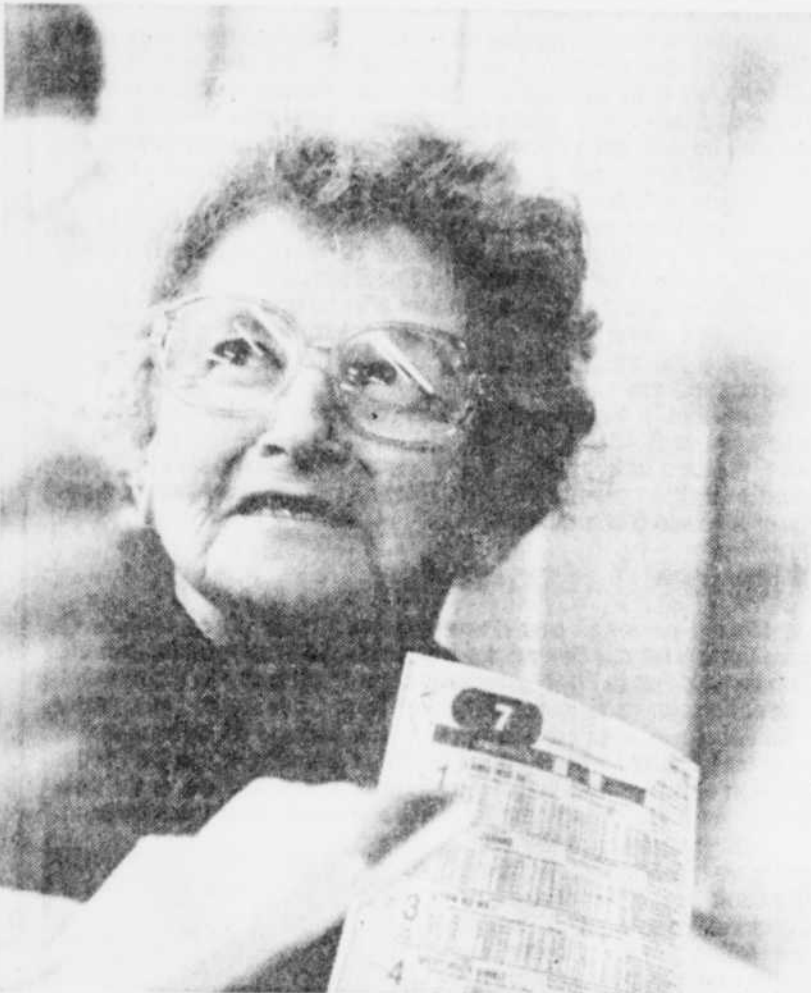
Le Soleil, Jean Vallières

"Si tu déjoues la combine, tu peux faire de l'argent"