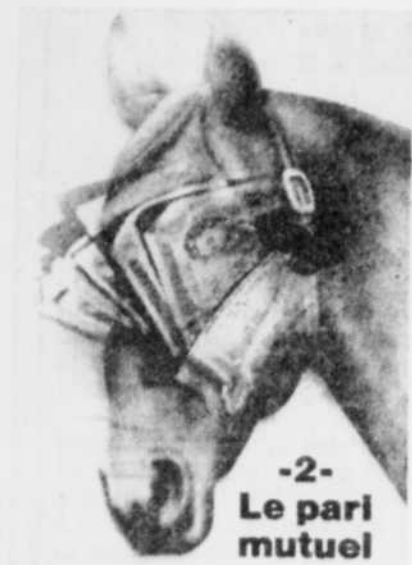
-2- Le pari mutuel

ans qu'il mise sur les chevaux de courses. Il a commencé à 15 ans.