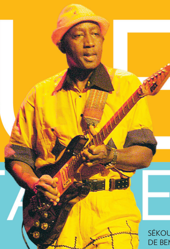
SÉKOU DIABATÉ DE BEMBEYA JAZZ