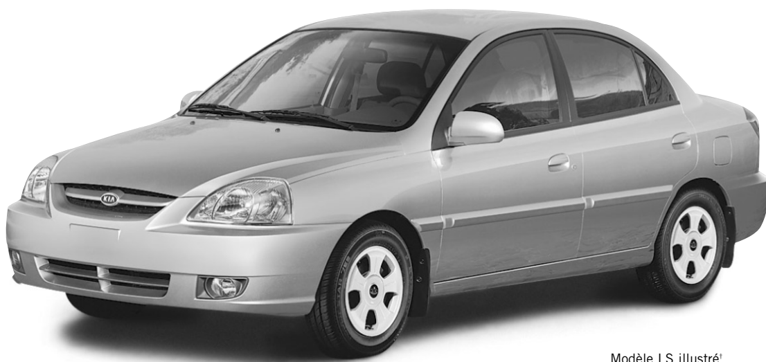
Modèle LS illustré* PDSF : 12 650 $**

LOCATION À PARTIR DE 129 $* PAR MOIS 60 MOIS