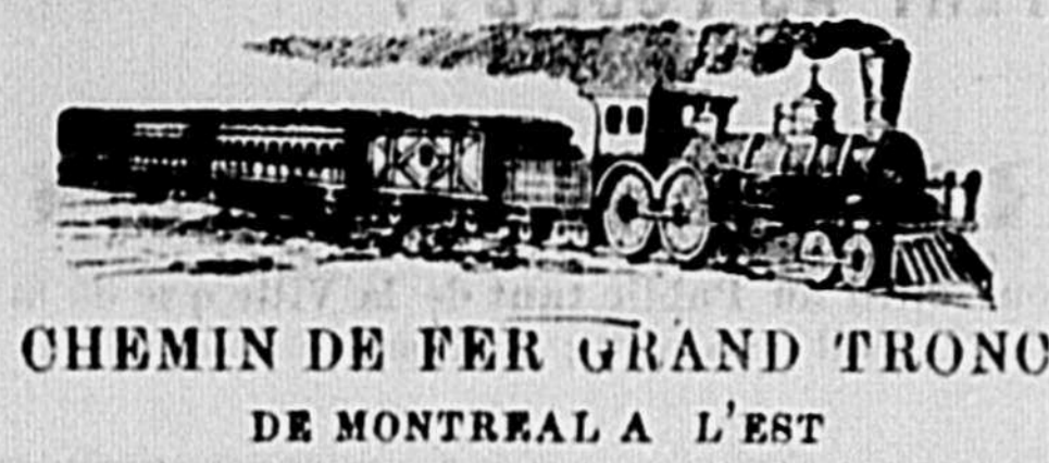
CHEMIN DE FER GRAND TRONC DE MONTREAL A L'EST