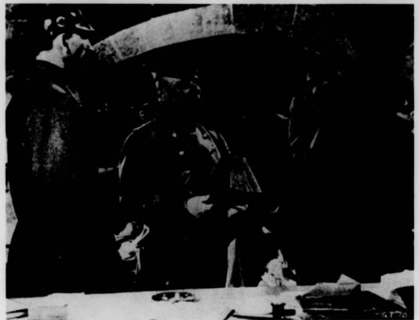
La Grande Illusion montrait avec vérité Eric von Stroheim dans le rôle d'un officier "qui alliait la sentimentalité d'une fleur de géranium coupée à la férocité froide qui abat à coups de revolver un railleur joueur de flûte".

La Grande Illusion de Renoir, qui inaugurera la saison de Ciné-Club , le 22 juin, est un très grand film. Georges Sadoul en fait l'analyse dans son Histoire de l'art du cinéma : "Le scénariste