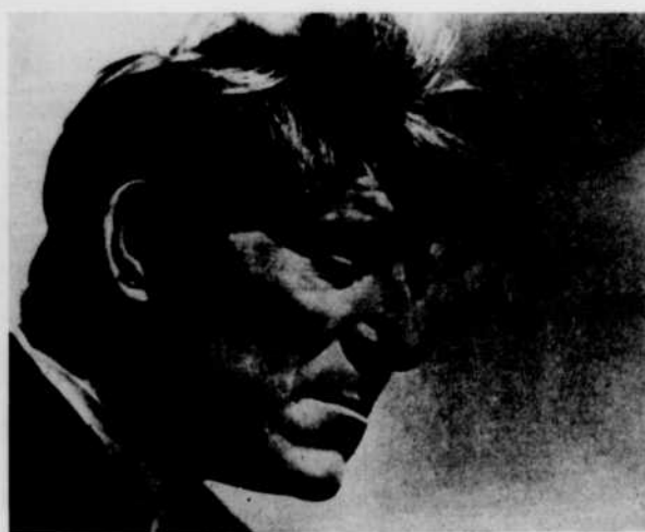
JEAN GABIN, dont on aperçoit ci-contre le masque tourmenté, fait, avec Pierre Fresnay, Eric von Stroheim, Dita Parlo et Dallio, partie de la distribution du célèbre film de Jean Renoir, La Grande Illusion , qui sera mis à l'affiche de Ciné-Club , vendredi 22 juin, à 9 heures du soir.