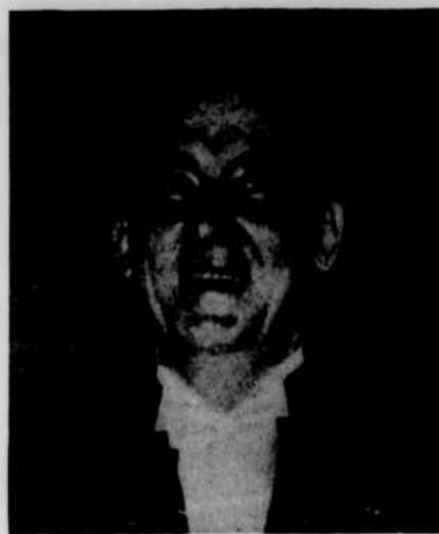
JACQUES DE LACRETELLE