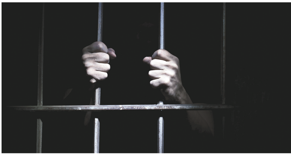
Les criminels psychopathes ne modifient pas leur comportement même s'il mène à une punition.