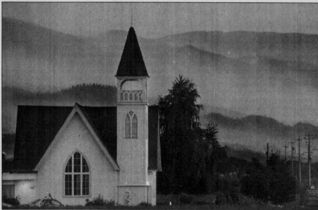
Cette petite église entourée de montagnes près de Kelowna, en Colombie-Britannique, donnait une image idyllique de la région pourtant toujours cernée par de multiples feux de forêt. Les habitants de la région ont cependant connu un certain répit hier, mais qui pourrait être de courte durée.

Le premier ministre Jean Chrétien s'est rendu hier à Kelowna et a survolé la région en compagnie du premier ministre de la Colombie-Britannique, Gordon Campbell, pour constater l'état des dommages. «La dévastation est in-