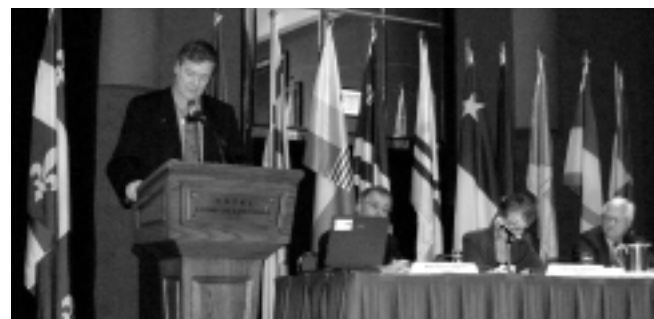
Le ministre délégué aux Affaires intergouvernementales canadiennes et aux Affaires autochtones, M. Benoît Pelletier, prononçant l'allocution de clôture du Forum sur l'éducation, le 2 novembre 2003.

Le regroupement des besoins exprimés, des solutions avancées et des projets proposés a fait ressortir certains axes de développement qui orienteront le suivi du forum. En voici la teneur :