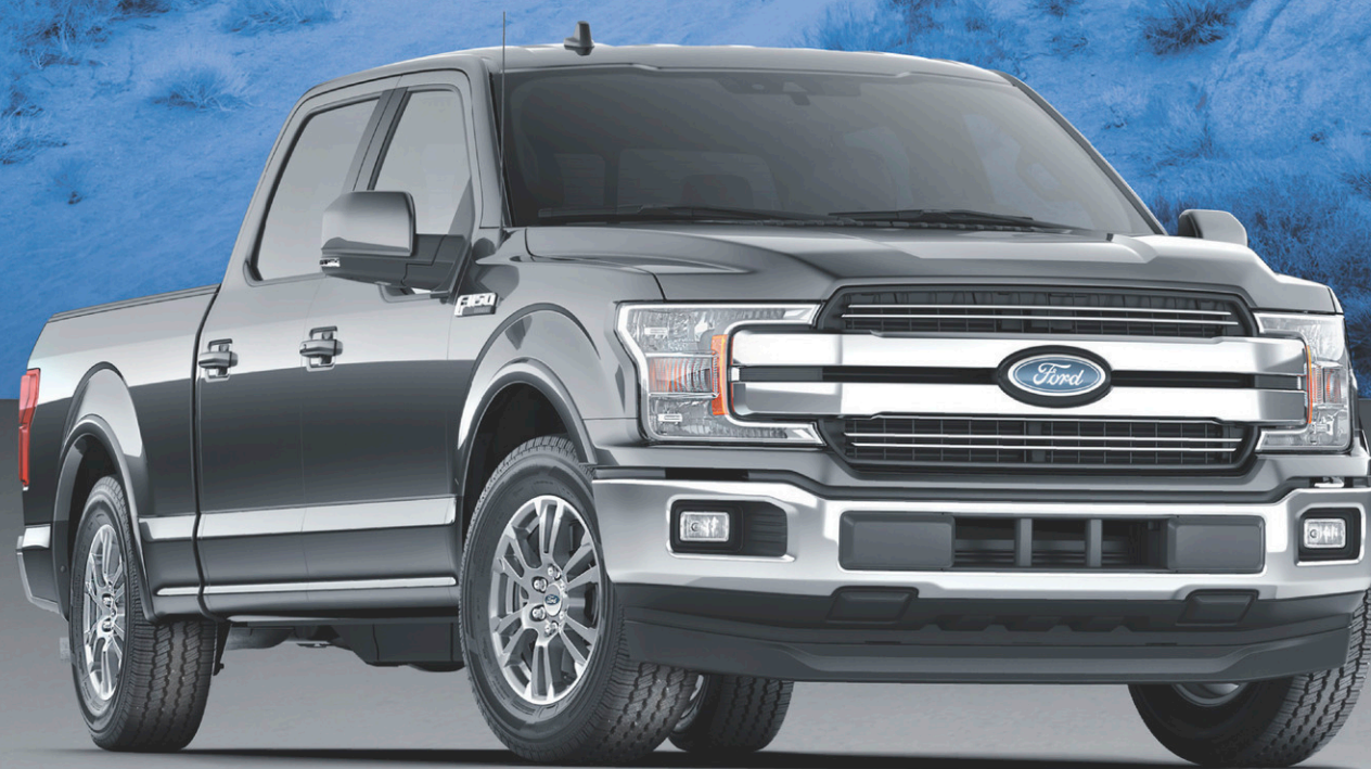
F-150 2020 LARIAT

LA SÉRIE F 54* LA PLUS VENDUE AU PAYS ANS