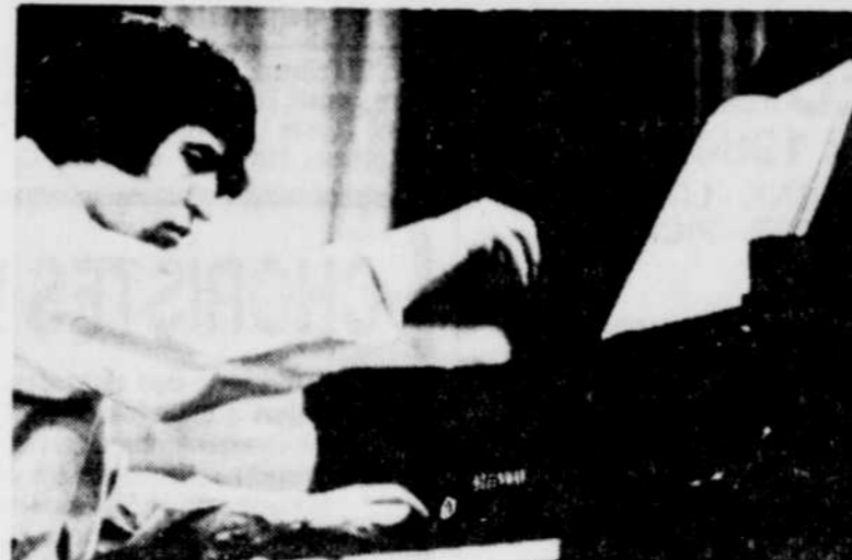
Un jeu magnifiquement contrôlé.