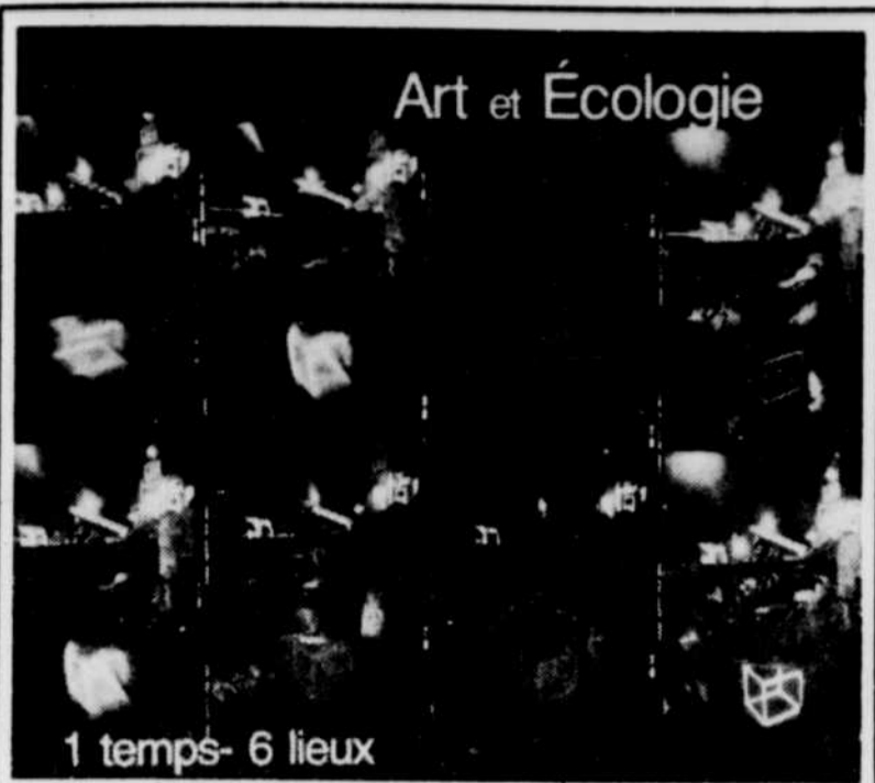
1 temps- 6 lieux