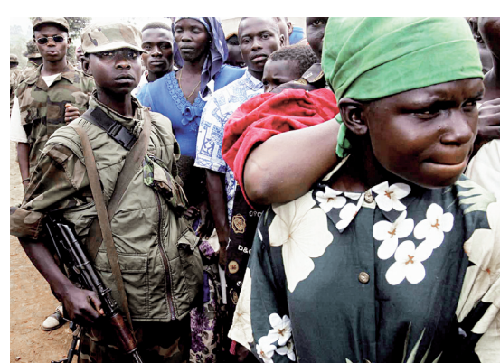
GIANLUIGI GUERCIA AGENCE FRANCE-PRESSE

Les étudiants opposés à la hausse des droits de scolarité ont manifesté à nouveau hier au centre-ville, après avoir reçu l'appui de la CSN, de la CSQ et de la FTQ. Ils tiendront cet après-midi une marche qui les mènera de l'Université de Montréal jusqu'aux bureaux du ministre des Finances, Raymond Bachand. Page A 2