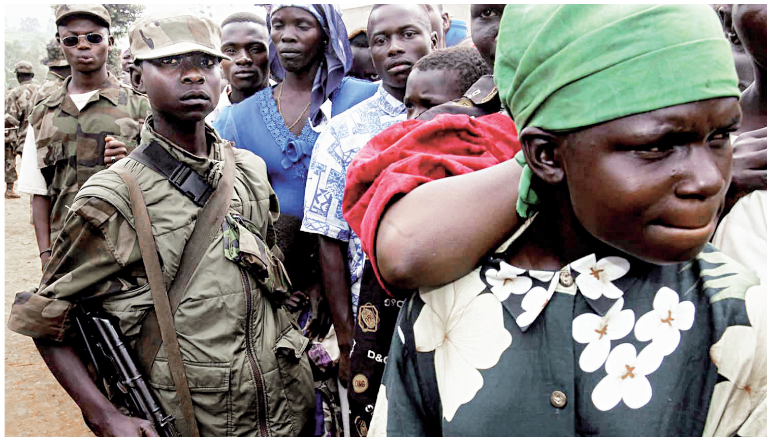
Un enfant soldat photographié en 2003 dans l'Ituri.