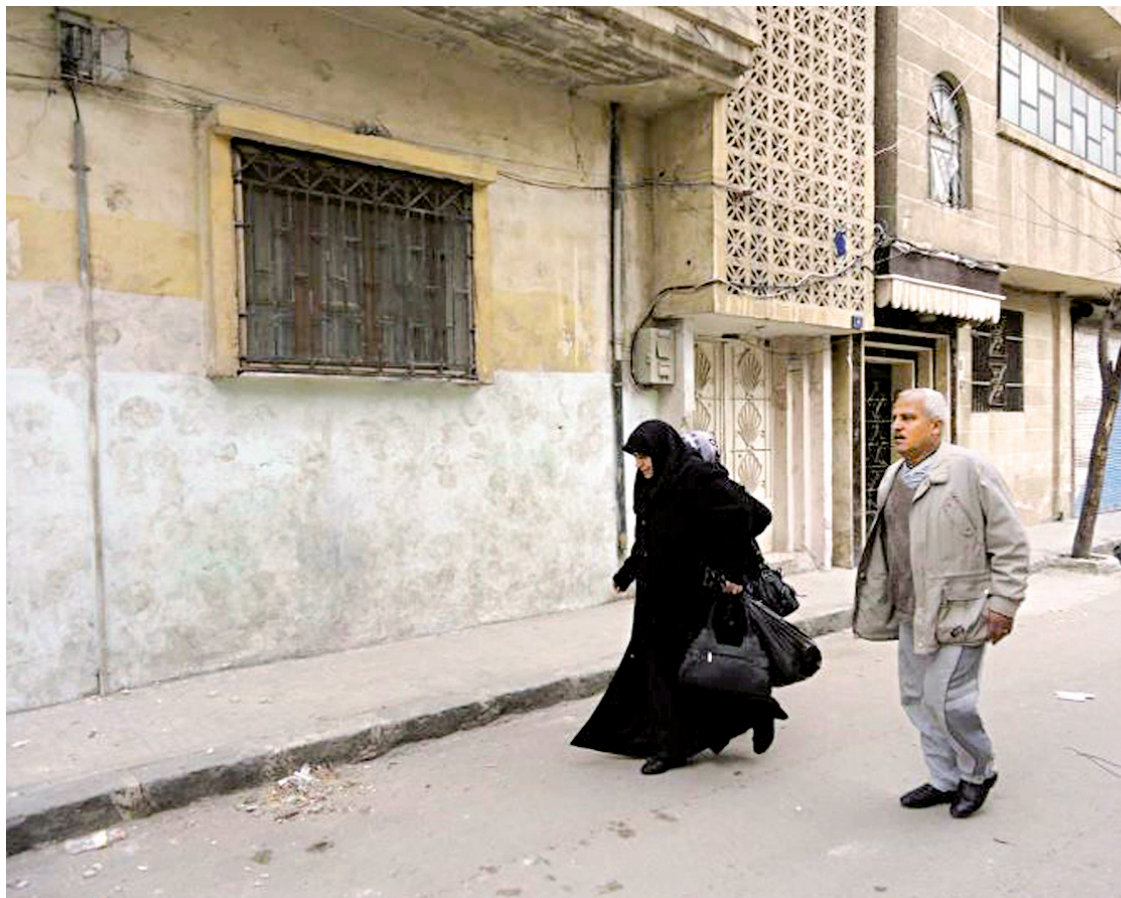
Ce couple de Syriens a quitté hier sa résidence de Homs.

D'autre part, l'OSDH fait état de la découverte lundi soir dans une mosquée de la ville de 11 corps de personnes qui auraient été tuées lors d'opérations de l'armée dimanche. L'AFP n'était pas en mesure de confirmer ces informations en raison des mesures draconiennes imposées par les autorités aux médias étrangers pour la couverture de la crise.