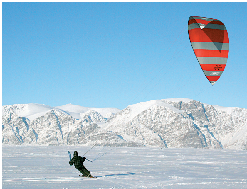
Les étendues glacées du Grand Nord s'offrent comme un terrain de jeu sans fin pour les adeptes du paraski.