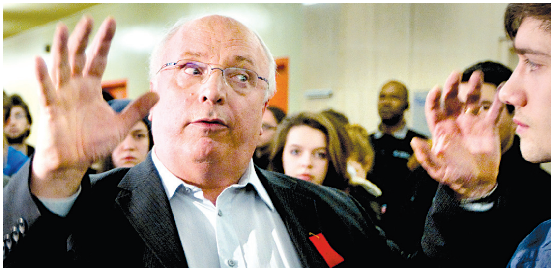
Le président de la Centrale des syndicats du Québec, Réjean Parent, était de passage hier au collège de Rosemont, à Montréal, pour offrir son appui aux étudiants. «La lutte des étudiants, c'est la lutte de tous les citoyens du Québec», a affirmé le dirigeant syndical.