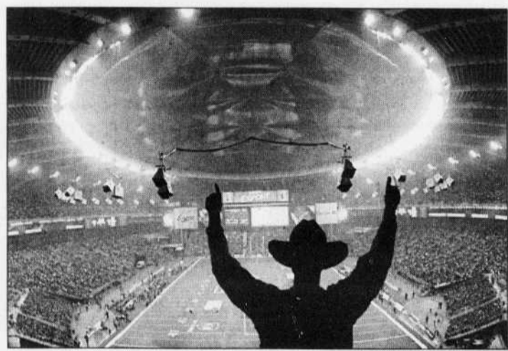
PETER JONES REUTERS

Mais les Alouettes ont connu une fin de saison atroce, ils ont perdu huit matchs de suite, ont