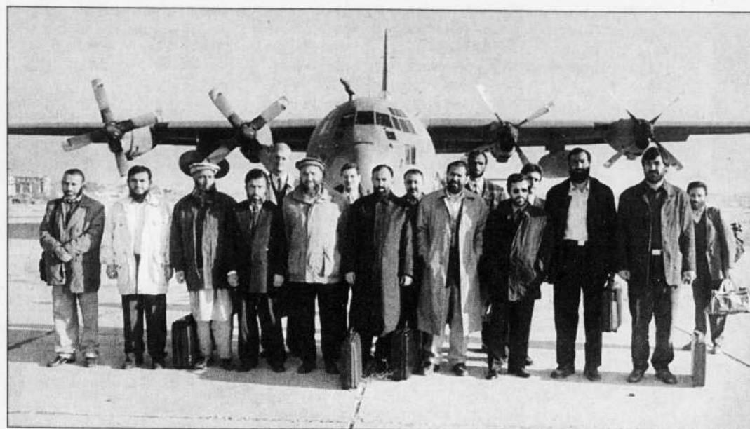
Délégués afghans et conseillers allemands à l'aéroport de Bagram, près de Kaboul, hier.

Ces 28 hommes et trois femmes auront pour tâche,