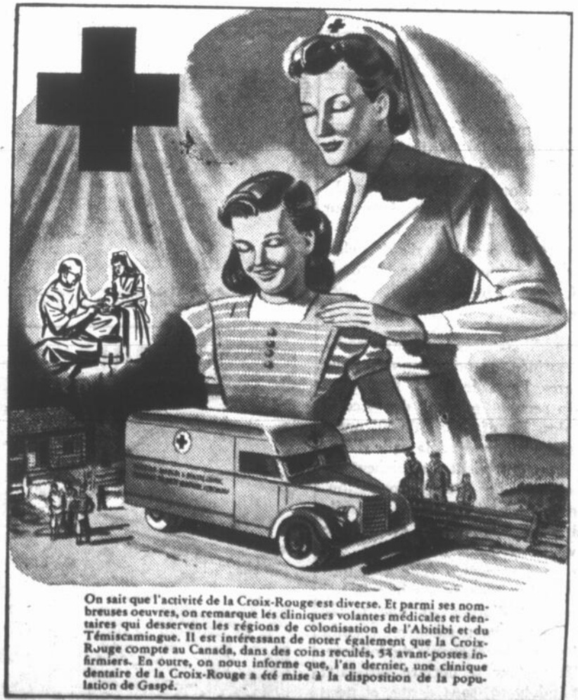
On sait que l'activité de la Croix-Rouge est diverse. Et parmi ses nombreuses oeuvres, on remarque les cliniques volantes médicales et dentaires qui desservent les régions de colonisation de l'Abitibi et du Témiscamingue. Il est intéressant de noter également que la Croix-Rouge compte au Canada, dans des coins reculés, 54 avant-postes infirmiers. En outre, on nous informe que, l'an dernier, une clinique dentaire de la Croix-Rouge a été mise à la disposition de la population de Gaspé.