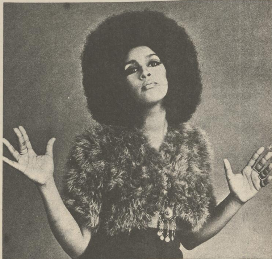
Marsha Hunt possède une chevelure exceptionnelle. Car ce n'est pas une perruque. Elle avait 15 ans quand elle a décidé de laisser sa tête en liberté, pour devenir une vraie beatnik. A 17 ans, elle a été remarquée dans un café de Londres par un producteur qui l'a engagée pour jouer une comédie musicale, à laquelle il a donné le titre de... « Hair » (La chevelure). C'est un prodigieux succès à Londres...

Les accrochages d'hiver entre fédérine et soldats jordaniens ont fait au total 19 tués et 30 blessés, a annoncé ce matin un porte-parole du FATH à Beaurivage. Parmi les tués, neuf sont des fédérine et des civils. Les dix autres sont des soldats jordaniens. Dix-sept soldats et 13 fédérine et civils ont été blessés. Les échanges de coups de feu ont cessé à zéro heure locale, a précisé le porte-parole.