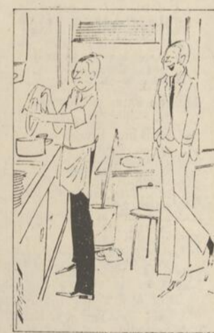
- Et dire que j'ai failli épouser ta femme...

Il y a une chose que les Canadiens rapportent beaucoup cette année: les sourires. Partout les vacances auront été bonnes. Partout le soleil a brillé. Il y a eu de sourires. L'hiver passé, dans les rues. Grâce au soleil, les sourires seront au moins la certitude de l'hiver 1970-71.