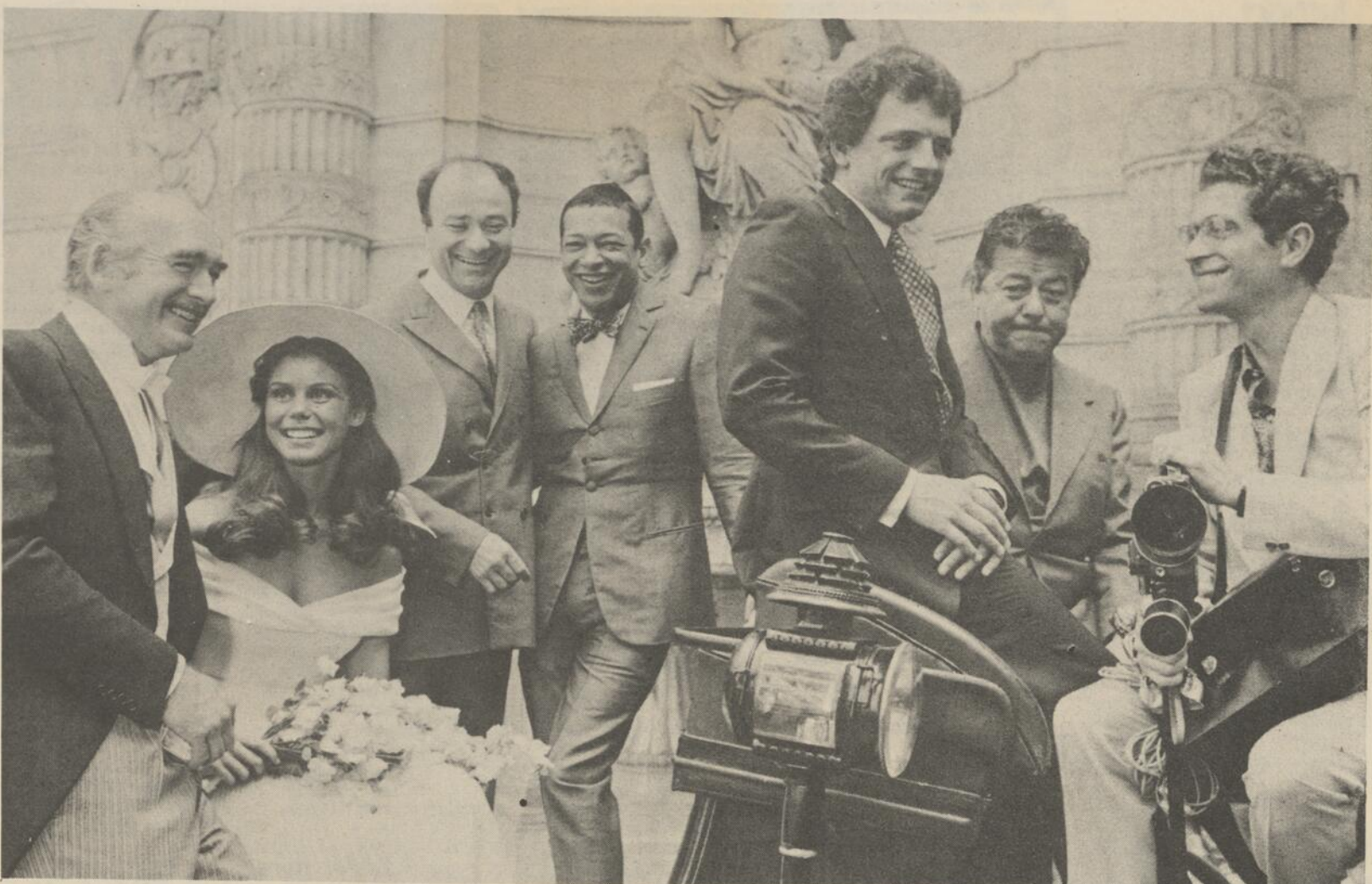
Pour son quatrième mariage, le producteur et éditeur de disques le plus célèbre de France, Eddie Barclay, a voulu le plus drôle, le plus comique et le plus parisien qu'il soit. Barclay a 49 ans alors que sa jeune épouse n'a que 19 ans. Lui habillé du smoking, elle d'une maxi-robe de mousseline jaune pâle toute plissée, se sont rendus à la mairie en calèche,

spectacle insolite dans Paris, Eddie Barclay a choisi pour témoins les vedettes les plus drôles: Francis Blanche, Darry Cowl, le comique régent Jacques Martin, Fernand Raynaud et Henri Salvador. Le cortège, après la cérémonie, s'est rendu au Bois de Boulogne pour déjeuner au soleil, puis une grande partie champêtre a suivi.