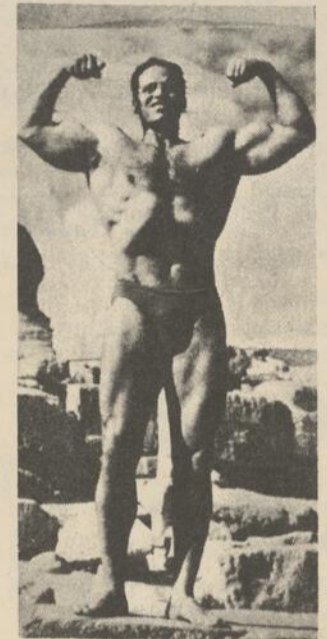
Le futur M. Univers est égyptien. Faut aimer.

Le leader travailliste ne s'est, semble-t-il pas aperçu de l'incident et le lanceur n'a pas été inquiété.