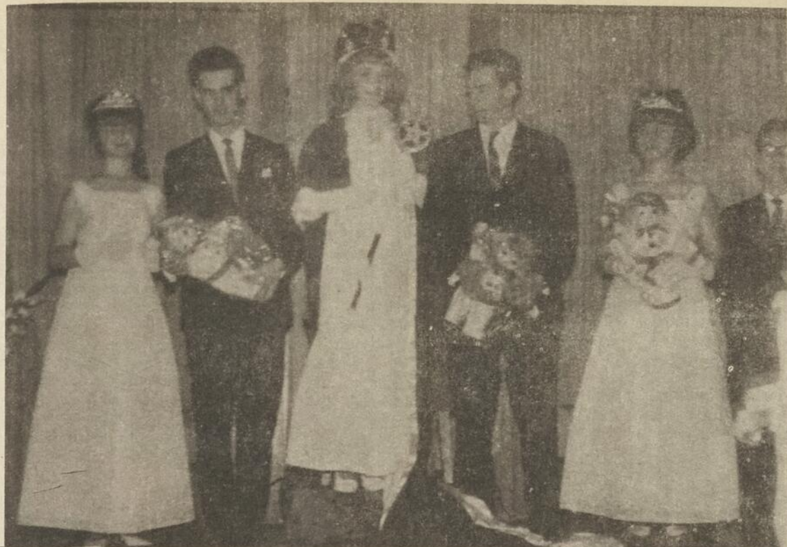
EN MARGE DE SON FESTIVAL