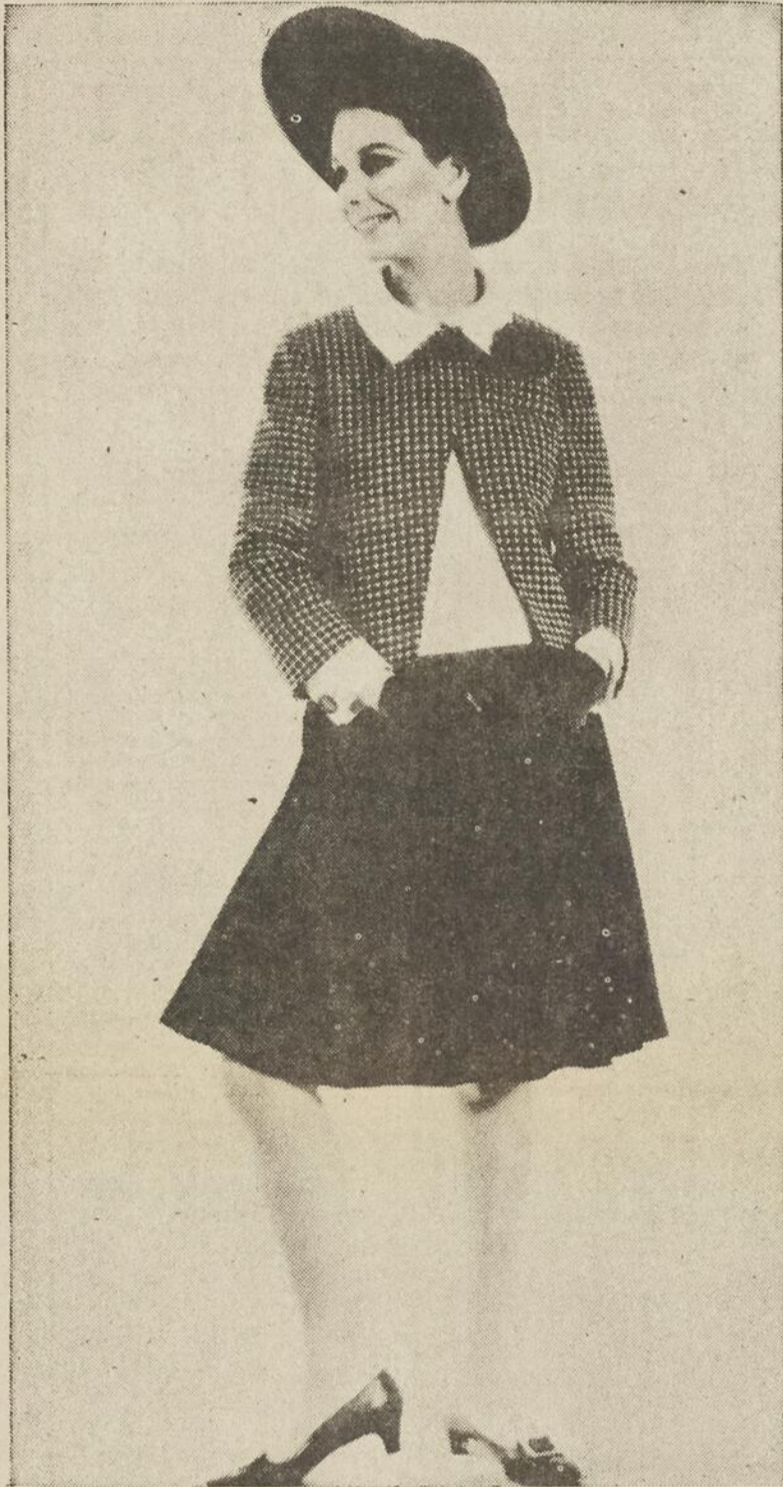
La collection Esprit est également dessinée par David Kidd. Mais elle porte l'étiquette de Jabé au lieu de Jablow ce qui signifie, pour les initiés que le prix des modèles ne dépassera pas $200. Une collection boutique à prix plus abordables donc pour les jeunes filles et les jeunes mariées. Ci-haut, ensemble de deux teintes bleu marine et rouge. La jupe à godets est coupée sur le biais, la veste s'ouvre sur un corsage de piqué.