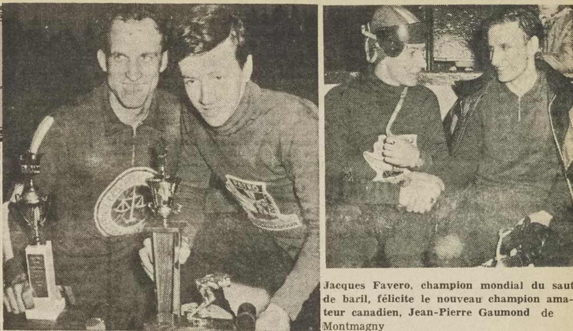
Les deux champions 1966