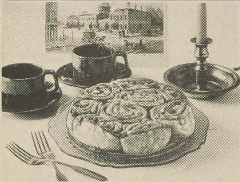
Les Roulades aux Fruits présentent une pâte délicieusement fondante, préparée à base de levure, et incrustée de noix, de raisins et de morceaux d'ananas. Une friandise toute spéciale pour l'heure du thé ou de la pause-café!