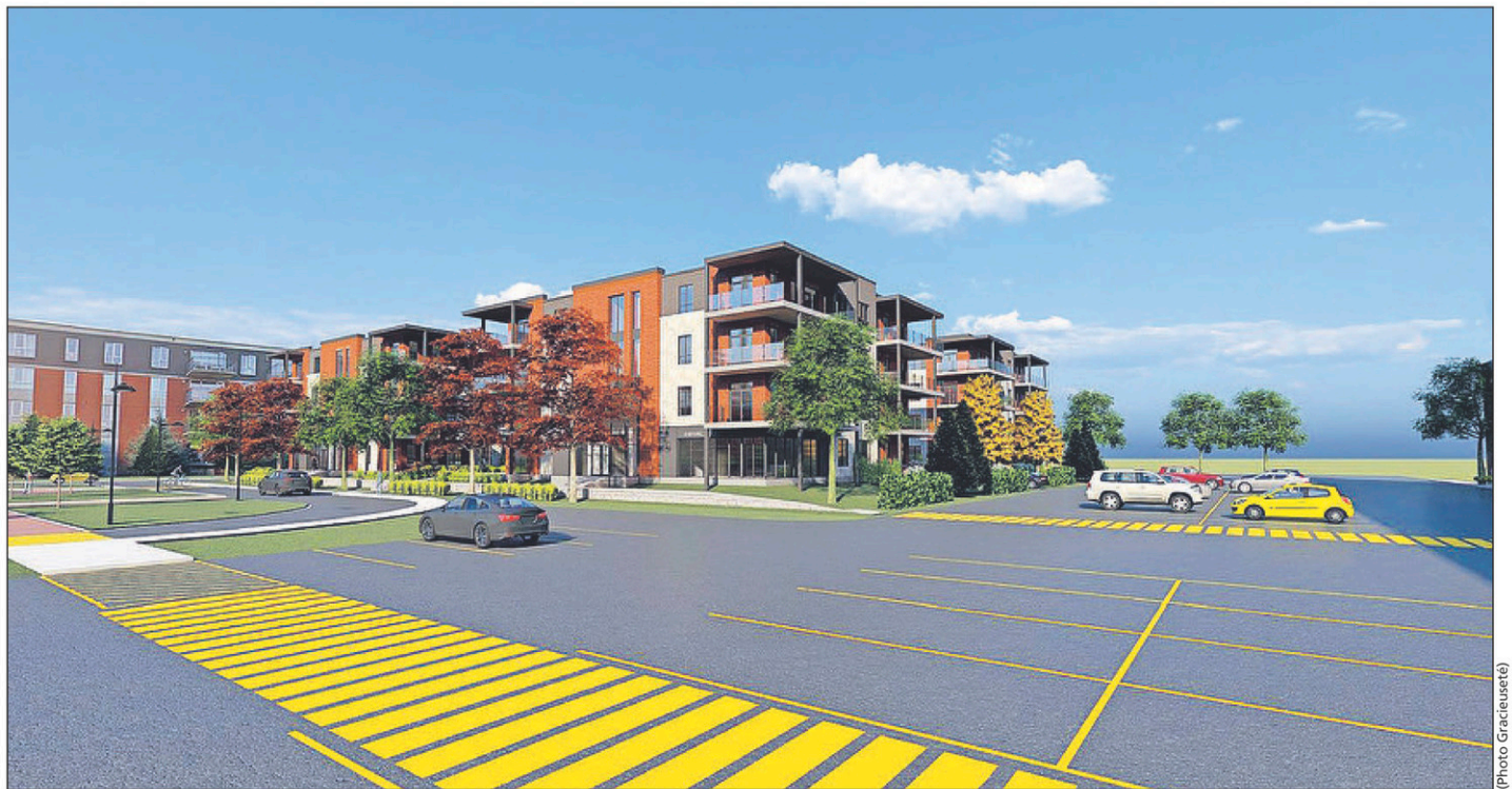
Les immeubles se trouveront entre la Cité des tours et les Cours Singer.

Le projet sera érigé à l'angle de la rue Saint-Paul et de la future rue de la Cabinetterie. Plus précisément, les bâtiments seront situés à l'ouest de la Cité des tours, à l'est des Cours Singer ainsi qu'au