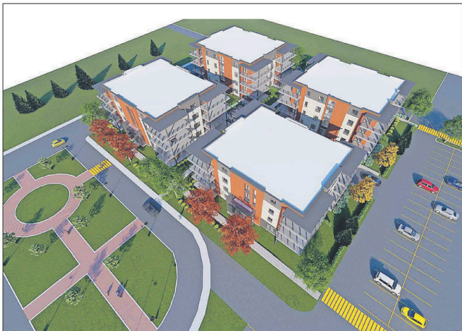
Chaque bâtiment abritera 16 logements. Au centre des quatre immeubles se trouvera une piscine extérieure.