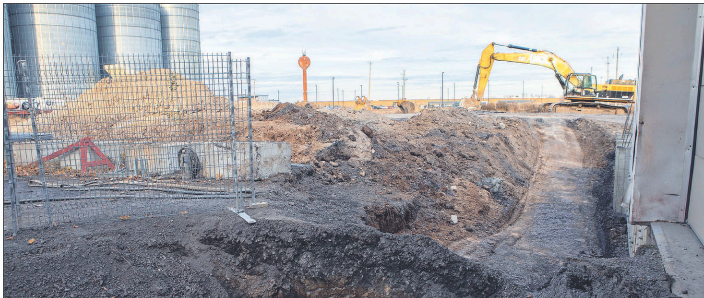
Les travaux ont débuté. La nouvelle partie de l'usine devrait être opérationnelle en juin prochain.

Il explique que les produits fabriqués par son entreprise possèdent des équipements très sophistiqués, notamment un système de prévention des incendies intégré, un système de filtration de l'air intégré, des paniers à levées automatiques, un système de filtration de l'huile interne, des contrôles tactiles, des détecteurs de pression, diverses options programmables, etc. « Une friteuse à frites se vend environ