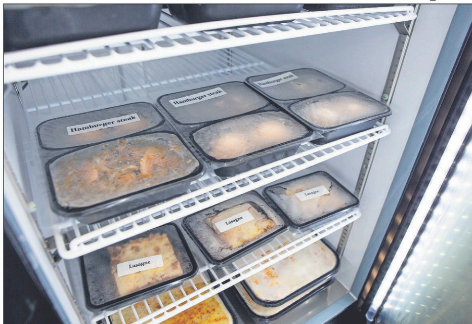
Le Centre d'action bénévole de Saint-Jean-sur-Richelieu aimerait acquérir 100 sacs thermiques afin de garantir à sa clientèle une livraison sécuritaire des plats cuisinés congelés.

Le Centre d'action bénévole de Saint-Jean-sur-Richelieu aimerait acquérir 100 sacs thermiques afin de garantir une livraison sécuritaire des plats cuisinés