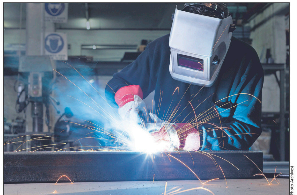
Les aides financières ont été approuvées lors d'une séance extraordinaire qui s'est tenue le 18 novembre dernier.

L'entrepreneur doit aussi démontrer que son entreprise était viable financièrement, qu'elle était en activité depuis au moins un an et elle ne doit pas être sous la protection de la Loi sur les arrangements avec les créanciers des compagnies ou de la Loi sur