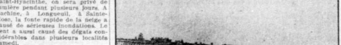
La débâcle de la rivière Nicolet. — Le pont de Sainte-Monique passant en face de la ville de Nicolet, hier après-midi.

Minée par les pluies abondantes de vendredi, la glace n'a pu résister au vent violent de samedi et s'est mise en mouvement dans plusieurs endroits. Cette débâcle préliminaire a causé des dommages considérables. La glace, etait en effet, encore verte et a tout balayé sur son passage. Des ponts et des maisons ont été emportés. D'autres ont été endommagés. Les granges ont subi des dommages importants et dans plusieurs localités on est privé de lumière électrique.