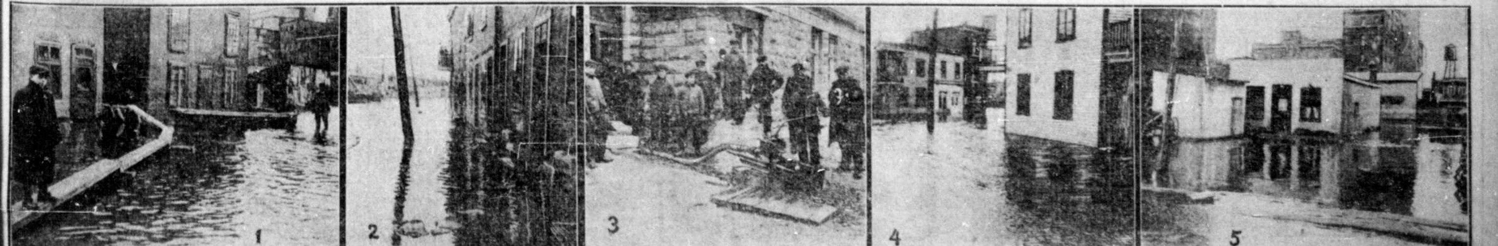
INONDATION A SAINT-HENRI ET A L'EGLISE SAINTE-CLOTILDE. — Au premier endroit les demeures d'une trentaine de familles ont été envahies par la rivière Saint-Pierre qui a débordé samedi. Ce sont les citoyens de la rue Sainte-Emilie qui ont le plus souffert. — 1. Un bataillon improvisé attend ses services au Turcot, au pied de la rue Saint-Remy; 2. L'eau dans la rue Sainte-Emilie attend le rez-de-chaussée des maisons; 3. Les employés de la voirie pompent l'eau qui a envahi l'église Sainte-Clotilde; 4. L'aspect que présentent les lieux inondés à l'angle des rues Sainte-Emilie et Saint-Remy; 5. Vue générale de l'inondation prise de la rue Saint-Pierre.

Hull, 17. — Les difficultés entre la ville de Hull et l'avocat McConnell ayant été réglées à l'amiable, ce dernier a retiré les procédures pour faire saisir l'hôtel de ville, et les autres propriétés de la ville.