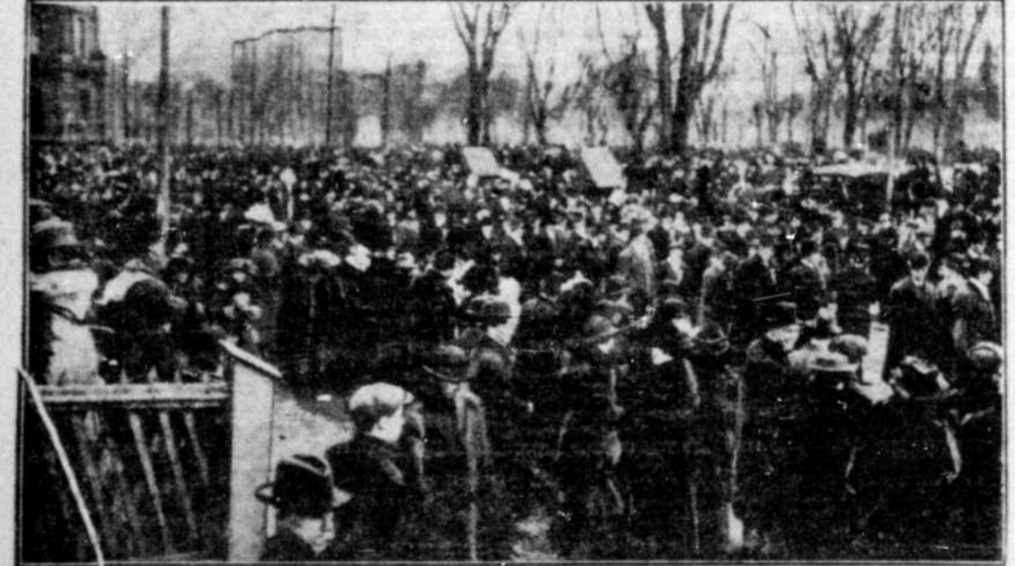
LA FETE NATIONALE DES IRLANDAIS — La foule, massée aux abords du Square Dominion, assiste au départ de la procession de la Saint-Patrice.

compagnie, pour les étrangers, quelque peu monotone; il nous faut cependant excepter le brillant corps militaire des chevaliers hiberniens, dont l'apparence est vraiment mariale, faisant plaisir à voir; la bannière de M. Red-