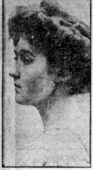
S. A. R. LA PRINCESSE PATRICIA, fille du duc et de la duchesse de Connaught, célèbre aujourd'hui son 27ème anniversaire de naissance, étant née le 17 mars 1886.