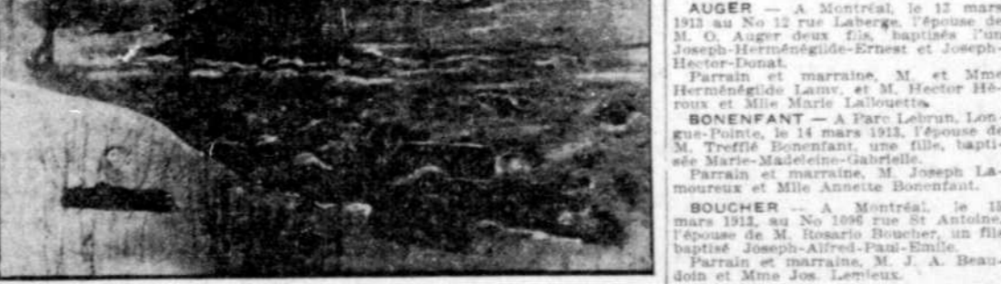
La débâcle de la rivière Nicolet. — Le pont des voitures de la ville de Nicolet, emporté hier matin, et les débris entraînés par le courant.

Nicolet, 17.—La journée du 16 mars 1913, dégats mémorables ici, à cause des vents survenus sur la rivière Nicolet, occasionnés par une subite chute des eaux et un départ prématuré des glaces. Dans la nuit de 15 au 16 courant, la glace se mit en mouvement et a emporté les ponts de Saint-Léonard, d'Arton, de Sainte-Monique et Nicolet. Les deux premiers dans la nuit, et celui de Nicolet à 430 heures hier après-midi. La foule qui était sur la rive vers les cinq heures, hier après-midi, put voir passer le pont de Sainte-Monique, qui s'était rendu presque intact jusqu'au pont de chemin de fer de la rue Saint-Jacques. On craignait un instant que le tablier en fer de ce pont se fut emporté. Mais grâce à sa hauteur, il fut épargné. A l'heure actuelle, le pont de Sainte-Monique est stationnaire, en face du couvent des Soeurs de l'Assomption, et rangé du long de terre, où il a pu être encastré. On espère pouvoir tirer parti des débris. Les ponts actuels de la compagnie sont MM. W. Smith, M.D. H. Courchesne, Donat Prox, Jean Rousseau, Ev. Dubuc, Jean-Baptiste Rousseau.