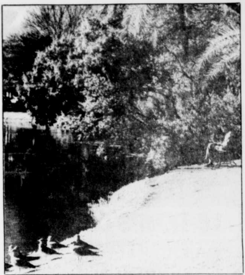
St. Petersburg offre quelques oasis de tranquillité, dont le Mirror Lake.

Enfin, si la plage est votre seul intérêt, celle-ci s'étire sur une quarantaine de kilomètres. Le secteur de Clearwater est le plus