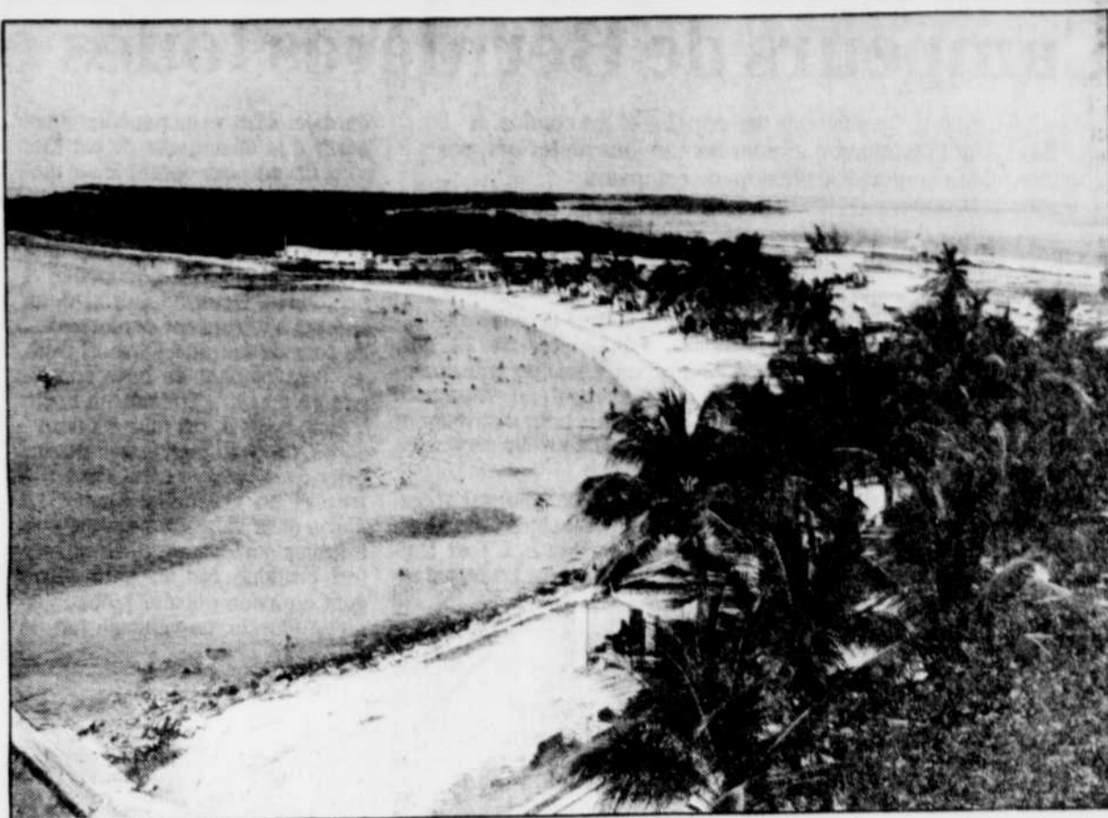
De nombreux forfaits en autobus sont offerts aux Québécois qui veulent se rendre sur les plages de Floride et les personnes âgées sont de celles qui ne dédaignent pas se les offrir.

« Les places disponibles sont presque toutes réservées, affirme M. Brett. Quelque 95 % de notre chiffre d'affaires est réalisé avec les personnes âgées et la situation économique actuelle semble moins affecter cette partie de la population que les jeunes. »