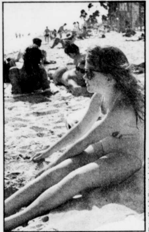
Sur les plages de la Floride, on se sent loin de l'hiver québécois.

et bien passé 183 jours, consécutifs ou non, au Québec, à l'intérieur d'une année civile, c'est-à-dire du 1er janvier au 31 décembre », rappelle le CAA-Québec.