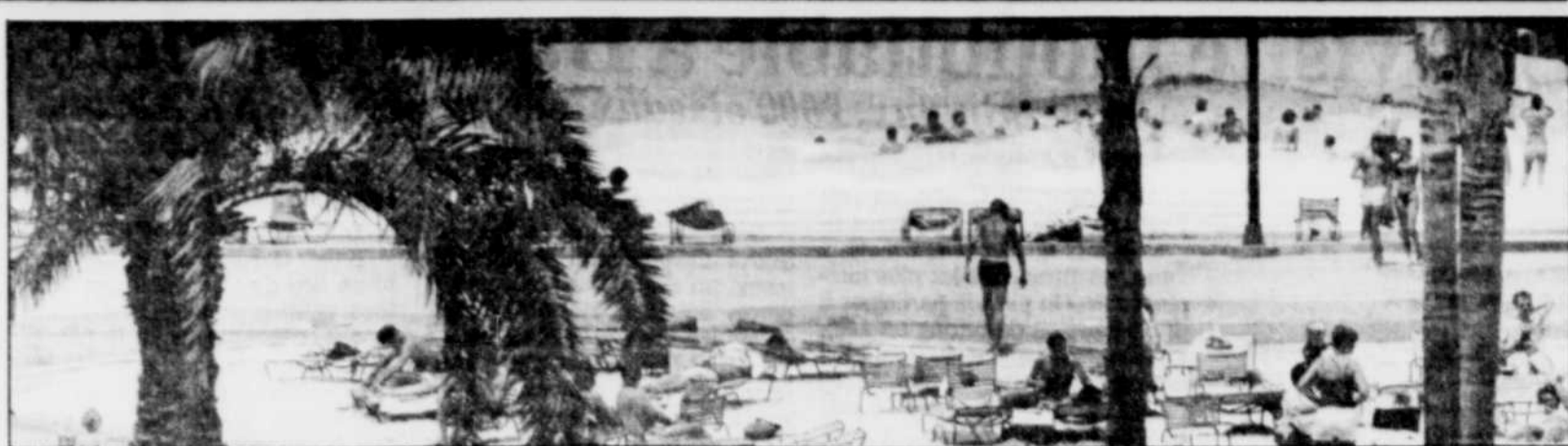
Le visage de Tampa a beaucoup changé. Mais une chose qui ne change pas, c'est la plage et le surf.

Un hôtel fut érigé au coût de 3,5 millions $. Chaque chambre, comble de luxe pour l'époque, disposait de l'éclairage électrique et d'un téléphone. L'hôtel avait, de plus, un casino, une piscine et un des premiers ascenseurs.