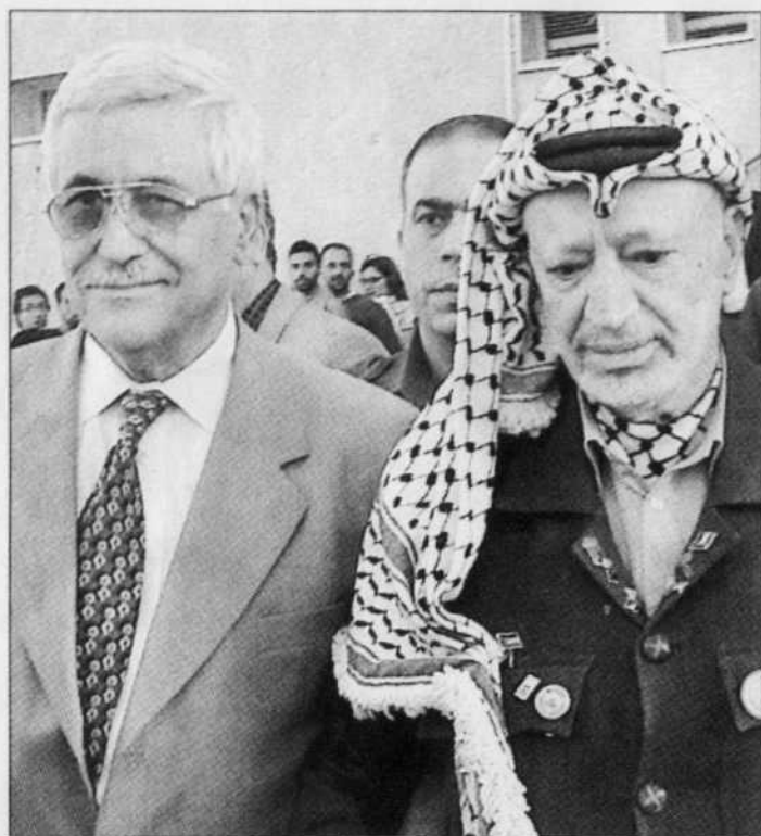
Mahmoud Abbas, que l'on voit ici marcher aux côtés de Yasser Arafat, a été nommé chef de l'Organisation de libération de la Palestine.

Il était formellement numéro deux du Fatah mais avait perdu beaucoup de son influence au