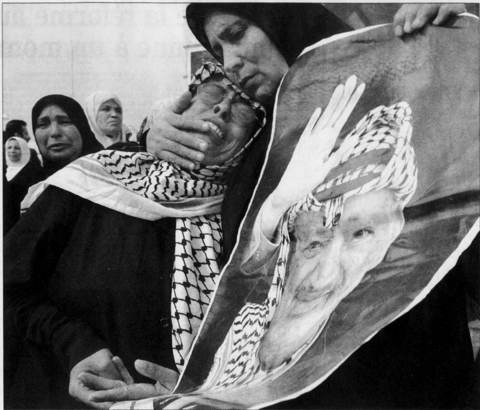
Des Palestiniennes pleurent la mort du père de leur peuple, Yasser Arafat, décédé dans la nuit de mercredi à hier dans un hôpital militaire français.