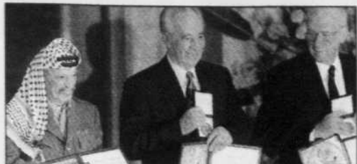
Octobre 1994, Yasser Arafat obtient le prix Nobel de la paix avec Shimon Peres et Yitzhak Rabin.