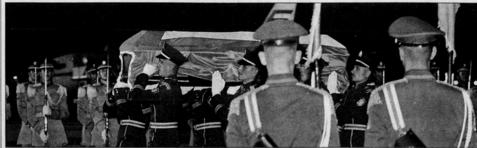
La dépouille de Yasser Arafat est arrivée au Caire hier soir, où les funérailles auront lieu aujourd'hui.