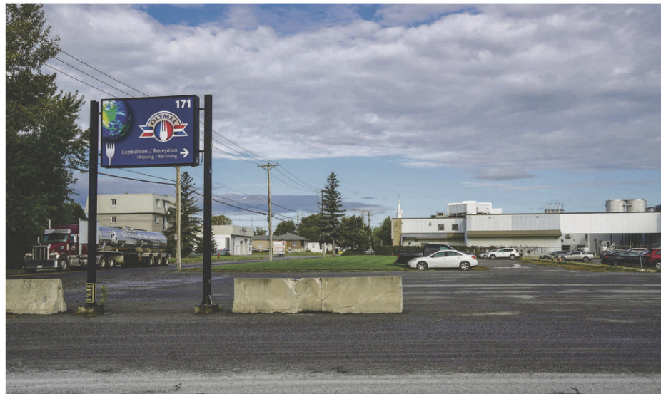
La Municipalité de Saint-Simon a acquis l'usine Olymel pour 6,6 M$ le 10 février.

La Municipalité a pu aller de l'avant avec cette acquisition puisque le règlement d'emprunt de 7,9 M$, adopté lors d'une séance extraordinaire le 13 septembre, a été autorisé par le ministre des Affaires municipales et de l'Habitation. Rappelons que la différence de 1,3 M$ entre l'offre d'achat acceptée par Olymel et le montant du règlement d'emprunt servira à payer des frais professionnels et une portion de la TVQ que la Municipalité ne récupérera pas.