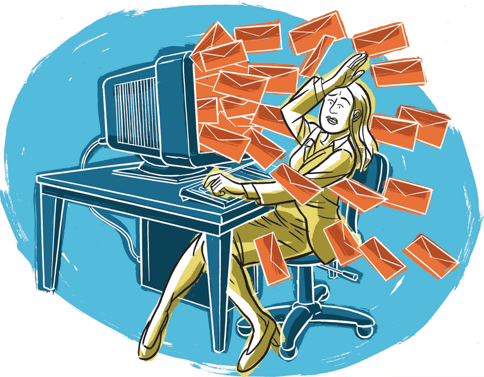
Illustration ANTHONY BAKER / deluxeluxury.com, collaboration spéciale