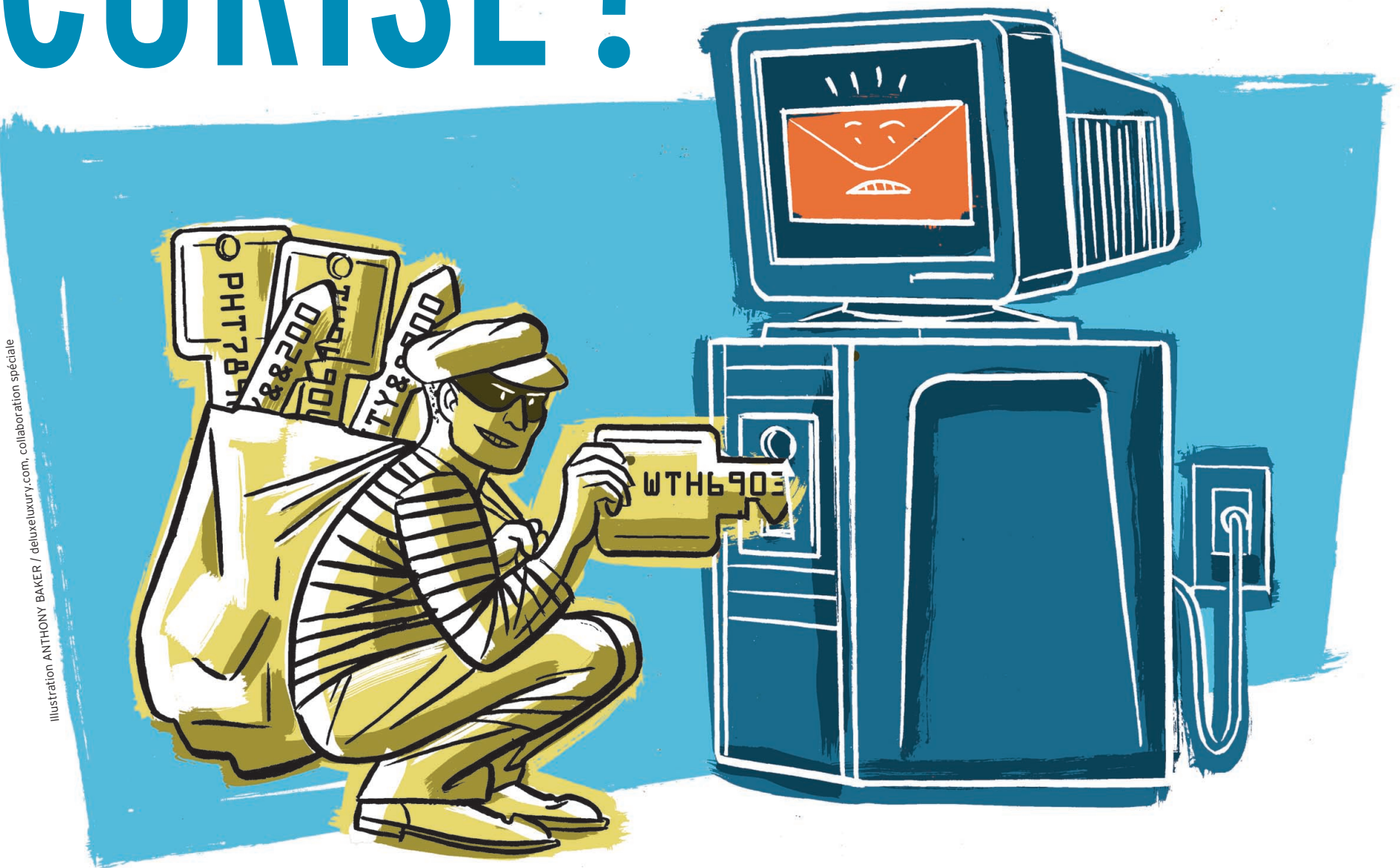
Illustration ANTHONY BAKER / deluxeluxury.com, collaboration spéciale

De plus en plus d'entreprises se servent du courrier électronique pour échanger non seulement des messages importants, mais également des documents stratégiques. Sécuriser ces échanges devient donc une nécessité.