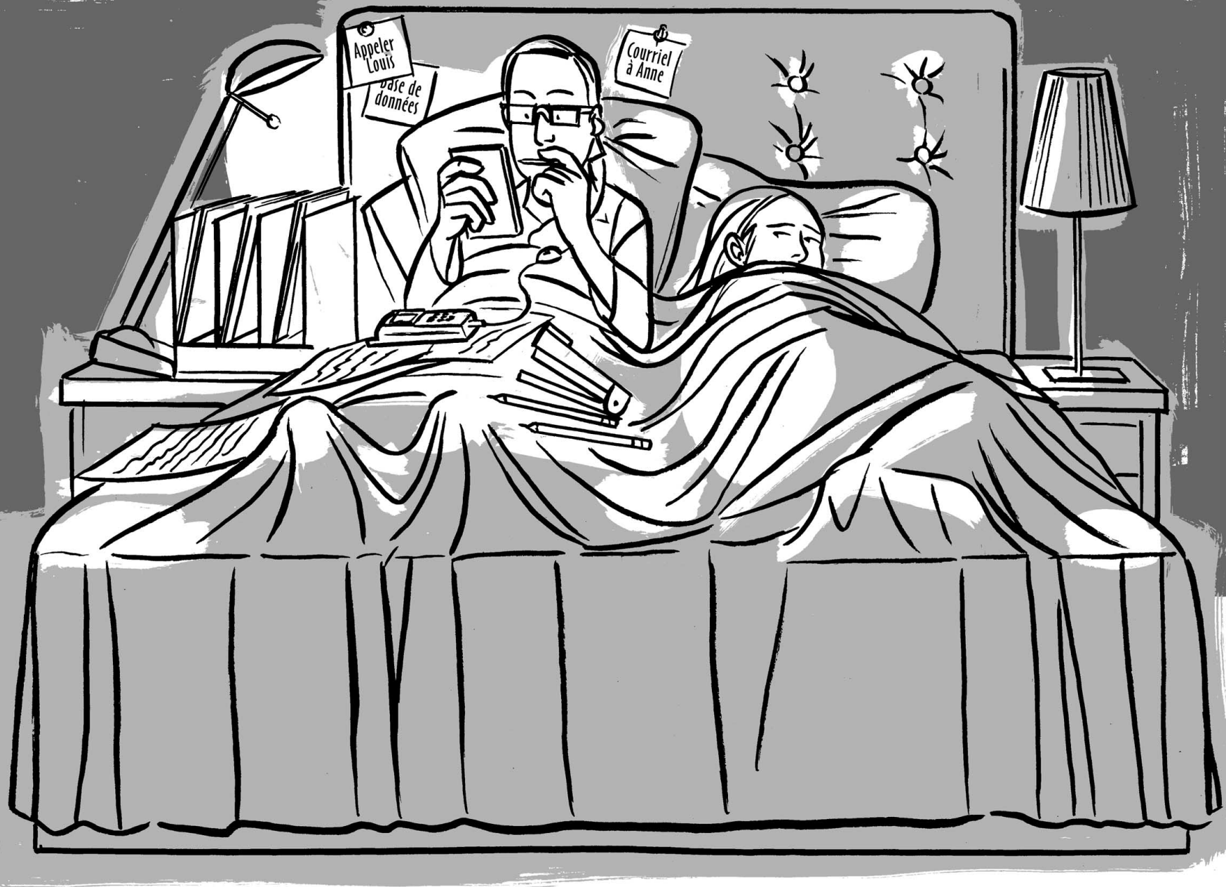
Illustration ANTHONY BAKER / deluxeluxury.com, collaboration spéciale

Grâce à l'accès sans fil, les ordinateurs portables sont devenus de véritables périphériques informatiques, des appareils qui font désormais partie du parc informatique des entreprises.