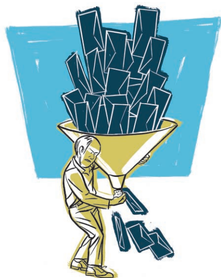
Illustration Anthony Baker, deluxeluxury.com, collaboration spéciale