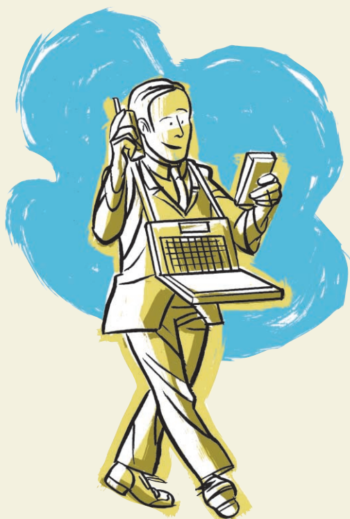
Illustration ANTHONY BAKER / deluxeluxury.com, collaboration spéciale