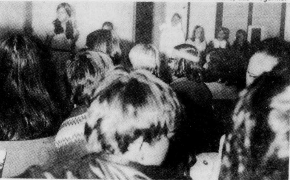
Une scène de la pièce de théâtre présentée par les otéjistes de Lac-Mégantic à l'occasion de la clôture des activités de l'OTJ.