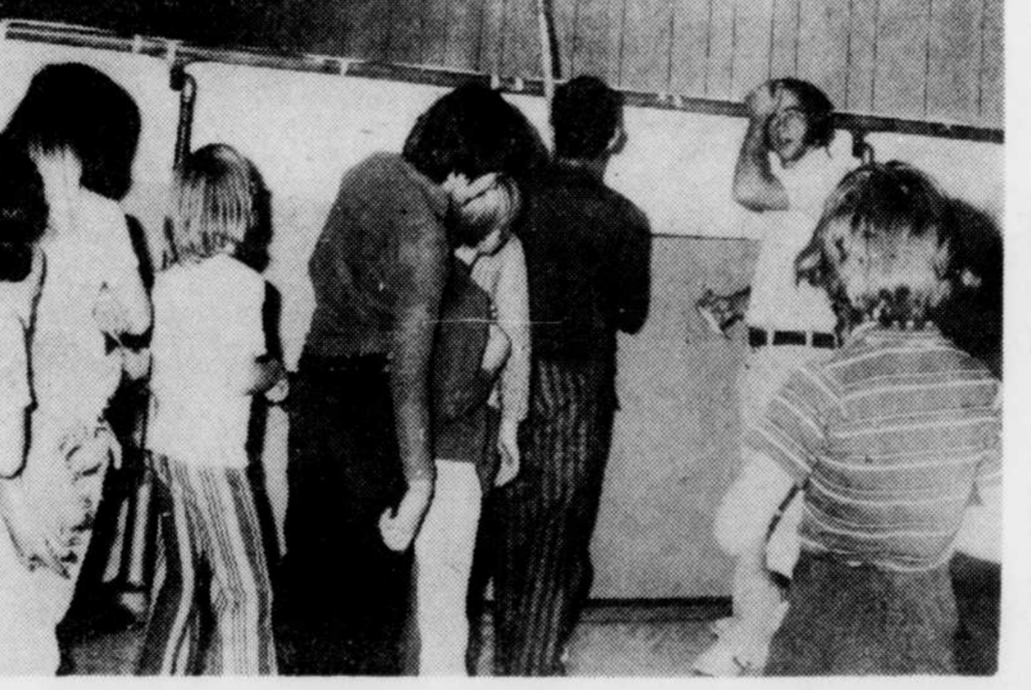
Les enfants des classes spéciales du Curé d'Auteuil s'en sont donné à coeur joie hier lors de la grande fête foraine organisée à leur intention et qui marquait la fin du projet Perspectives-jeunesse intitulé "Loisirs vacances pour les enfants des classes spéciales de l'école Curé d'Auteuil".