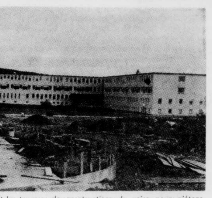
La photo présente reproduit les travaux de constructions de voies pour piétons qui une fois terminés donneront un bon accès à l'École polyvalente de Thetford Mines dans à peu près toutes les directions.

Cette voie de dégagement d'une longueur de 2,49 milles qui desservira le campus scolaire de la polyvalente de Thetford sera située en majeure partie dans la municipalité de Thetford-Sud. Selon M. Boucher, les ingénieurs ont été autorisés à préparer les plans et devis du projet et aussitôt ceux-ci terminés, la ville ira en soumissions. Il ne restera plus alors qu'à bien clarifier le partage des responsabilités financières entre les deux municipalités concernées.