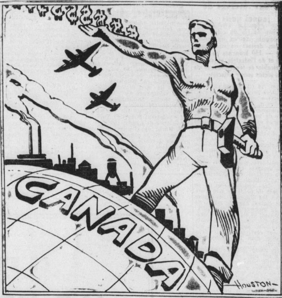
Dessin offert gracieusement par l'artiste Houston, des Trois-Rivières, à l'occasion du 3e emprunt de la Victoire.