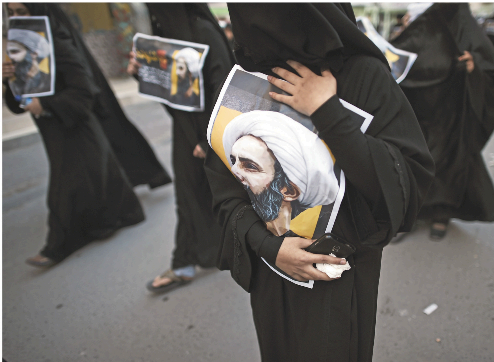
Manifestation de femmes dans le village de Jidhafs, à Bahreïn, contre l'exécution du chef religieux chiite Nimr Baqer al-Nimr