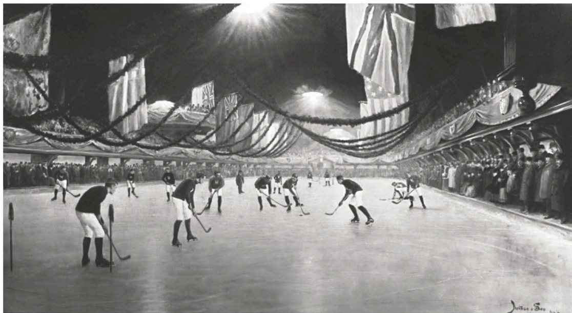
À son ouverture en 1862, le Victoria Skating Rink, rue Drummond, à Montréal, accueille des matchs de hockey (ici en 1893). Il sera également le premier bâtiment électrifié du Canada.

Au XIX e siècle, on pratique des styles de patin très différents de ceux que l'on connaît aujourd'hui. D'abord, le style