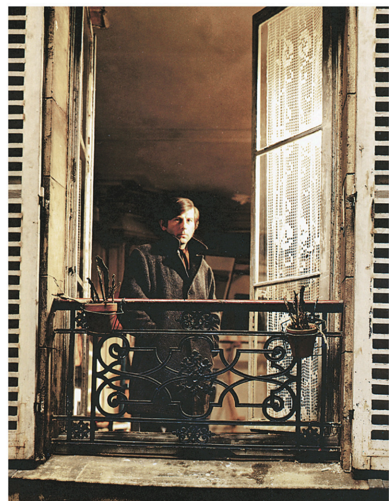
Roman Polanski dans Le locataire . Image tirée de l'ouvrage Polanski par Polanski , publié aux éditions Chêne en 1986.