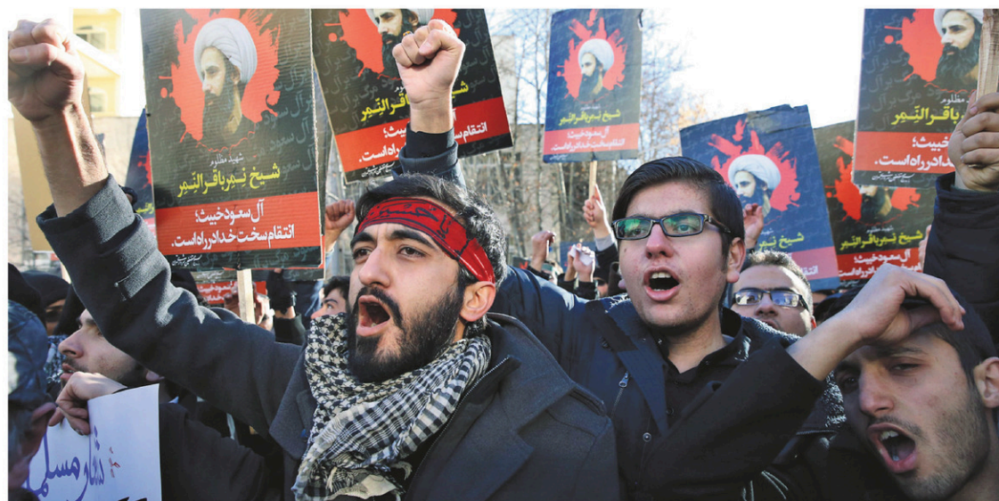
Une manifestation s'est déroulée dimanche devant l'ambassade saoudienne à Téhéran.

Au Liban, Hassan Nasrallah, chef du puissant mouvement chiïte Hezbollah allié de l'Iran, a vivement condamné