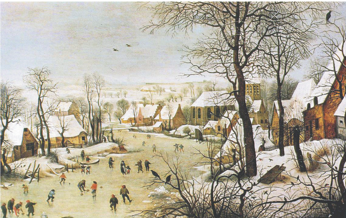
Les tableaux des maîtres flamands présentent des scènes hivernales où l'on s'adonne au patin. Le Paysage d'hiver avec patineurs et trappe aux oiseaux de Brueghel l'Ancien en offre un bel exemple (1565).

dit militaire ou anglais. Il est difficile d'imaginer de quoi cela avait l'air exactement, sauf si on est à même de s'imaginer le croisement improbable d'une relève de la garde à Buckingham Palace avec la grâce des mouvements d'un robot plongé dans l'eau glacée.