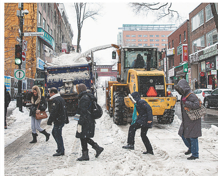
Tous les arrondissements montréalais chargeaient la neige, dimanche, tandis qu'une fine couche tombait encore.