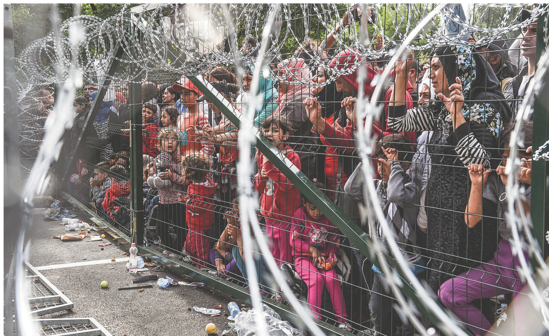
La «sécurisation» des frontières a échoué, dit François Crépeau. Sur cette photo prise en septembre dernier, des dizaines de migrants attendent à la frontière de la Hongrie et de la Serbie. Plusieurs pays européens ont réinstauré des contrôles aux frontières, tandis que d'autres ont érigé des clôtures.