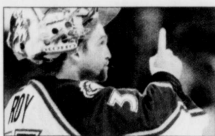
ARCHIVES, LE SOLEIL

«C'est intéressant. Tu te rends compte un moment donné que tu es rendu à cette étape dans ta carrière, a mentionné le gardien de l'Avalanche du Colorado au cours d'une entrevue téléphonique. Pour dire vrai, dans les premiers temps de ma carrière, ce n'est pas une statis-