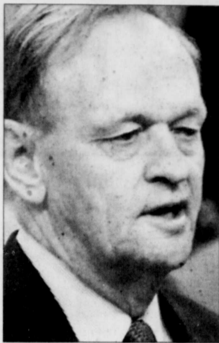
Il semblait évident, hier, que le gouvernement québécois cherchera à transformer ce « coup de force » fédéral en tremplin pour réunir les conditions gagnantes en vue d'un prochain référendum.