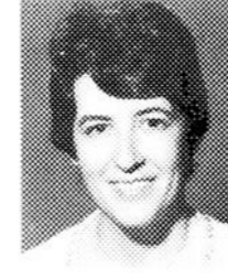
Micheline Liboiron Montréal