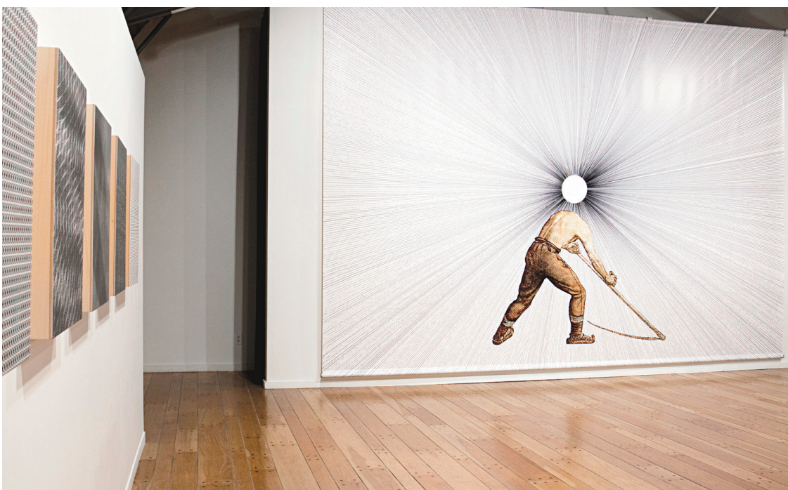
Mathieu Beauséjour, Icarus: Acéphale , 2011