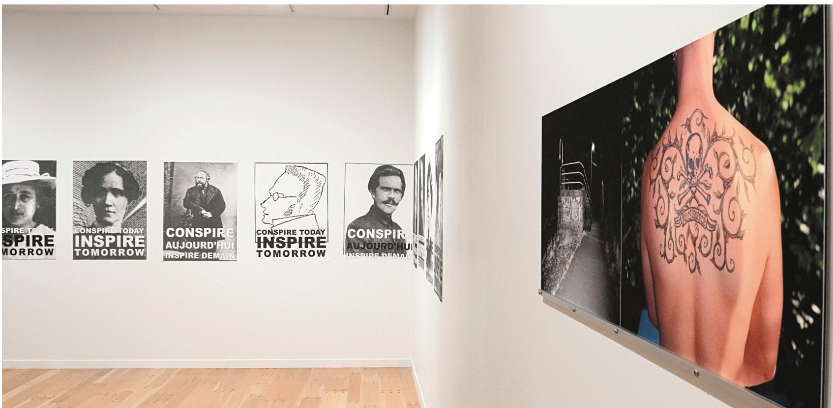
Mathieu Beauséjour, Révolution sur papier archive , 2002

CAHIER E • LE DEVOIR, LES SAMEDI 9 ET DIMANCHE 10 AOÛT 2014