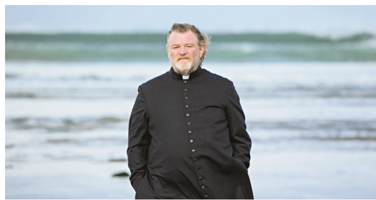
Brendan Gleeson est brillant dans le rôle principal.