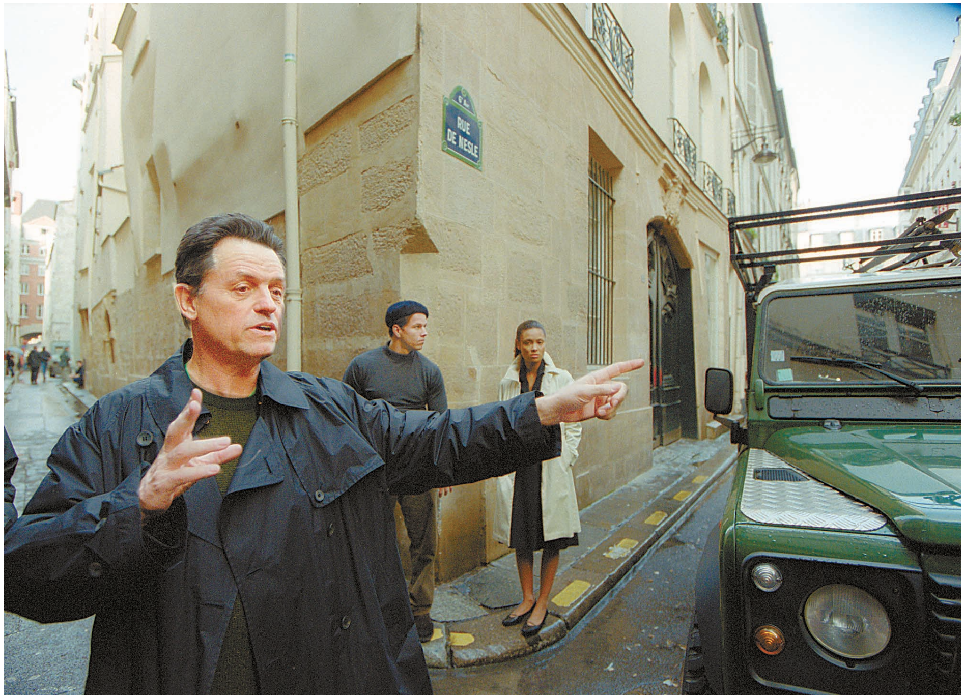
Paris, mise en valeur par tant de cinéastes de la Nouvelle Vague, défile derrière les pas des héros de The Truth About Charlie , interprétés par Mark Wahlberg et Thandie Newton (à l'arrière-plan). Le réalisateur Jonathan Demme (devant) a justement voulu donner à son remake un petit cachet New Wave .

CAHIER C | LA PRESSE | MONTRÉAL | VENDREDI 25 OCTOBRE 2002