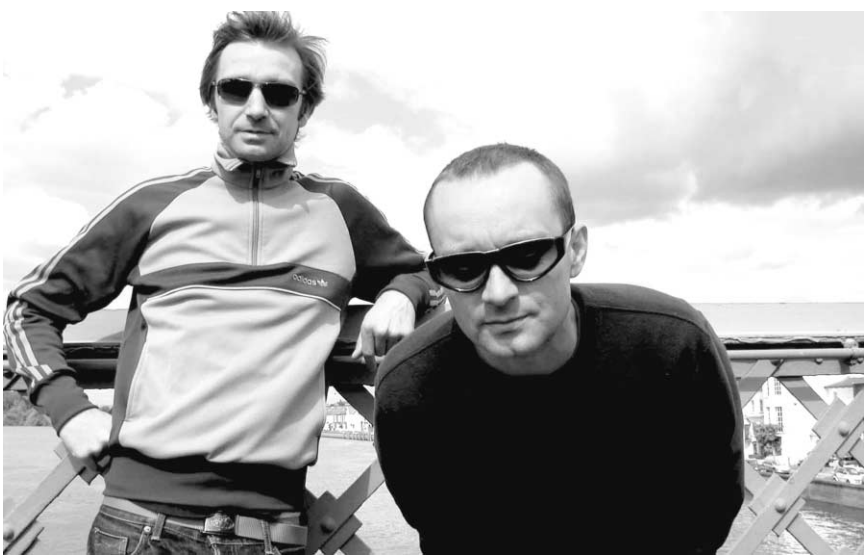
Le tandem Swayzak livre ses rythmes house teintés de références pop au Club Soda, ce soir, dans le cadre du MEG.