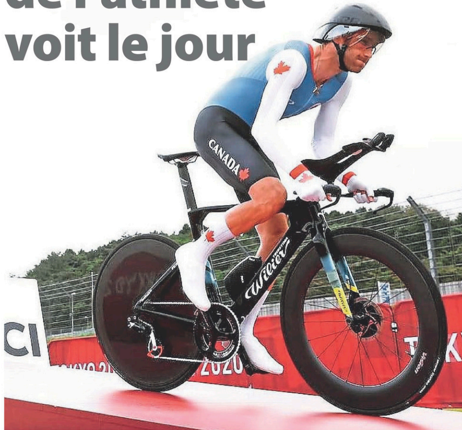
Le cycliste professionnel Hugo Houle.