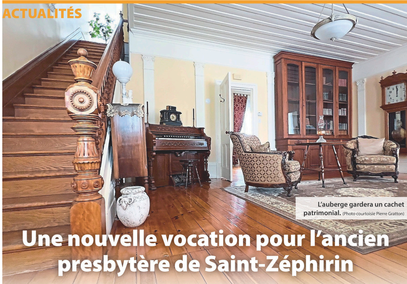
L'auberge gardera un cachet patrimonial.