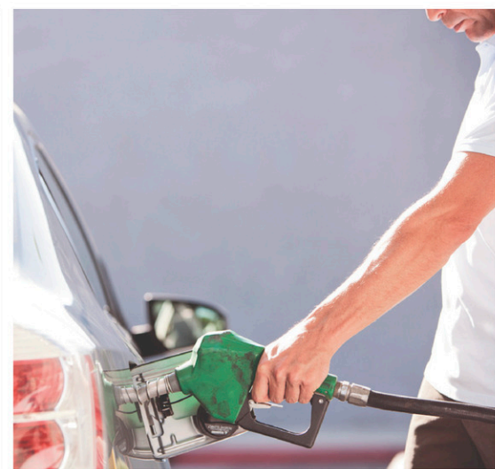
L'inflation a notamment été alimentée par les prix de l'essence à la pompe.

Avec La Presse canadienne Agence France-Presse