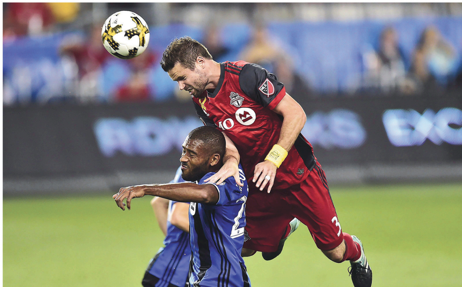
La formation montréalaise a offert une performance inspirée au BMO Field pour vaincre le Toronto FC, le 20 septembre dernier.