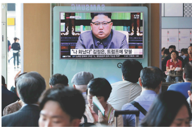
Des Nord-Coréens écoutent la déclaration de leur leader.

« Kim Jong-un de Corée du Nord, clairement un fou qui ne craint pas d'affamer et de tuer son peuple, va être mis à l'épreuve comme jamais ! » avait lancé plus tôt M. Trump dans un tweet particulièrement matinal. Ce dernier intervient au lendemain de l'annonce par Washington d'un renforcement des sanctions contre Pyongyang en réponse à la poursuite de son programme nucléaire.