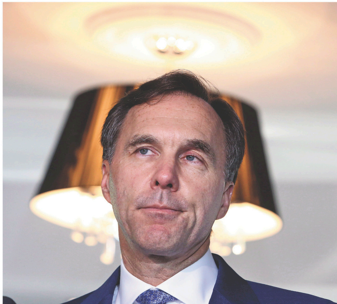
FRED CHARTRAND LA PRESSE CANADIENNE

Les explications du fédéral ne suffisent toutefois pas à apaiser les inquiétudes. «Posez-