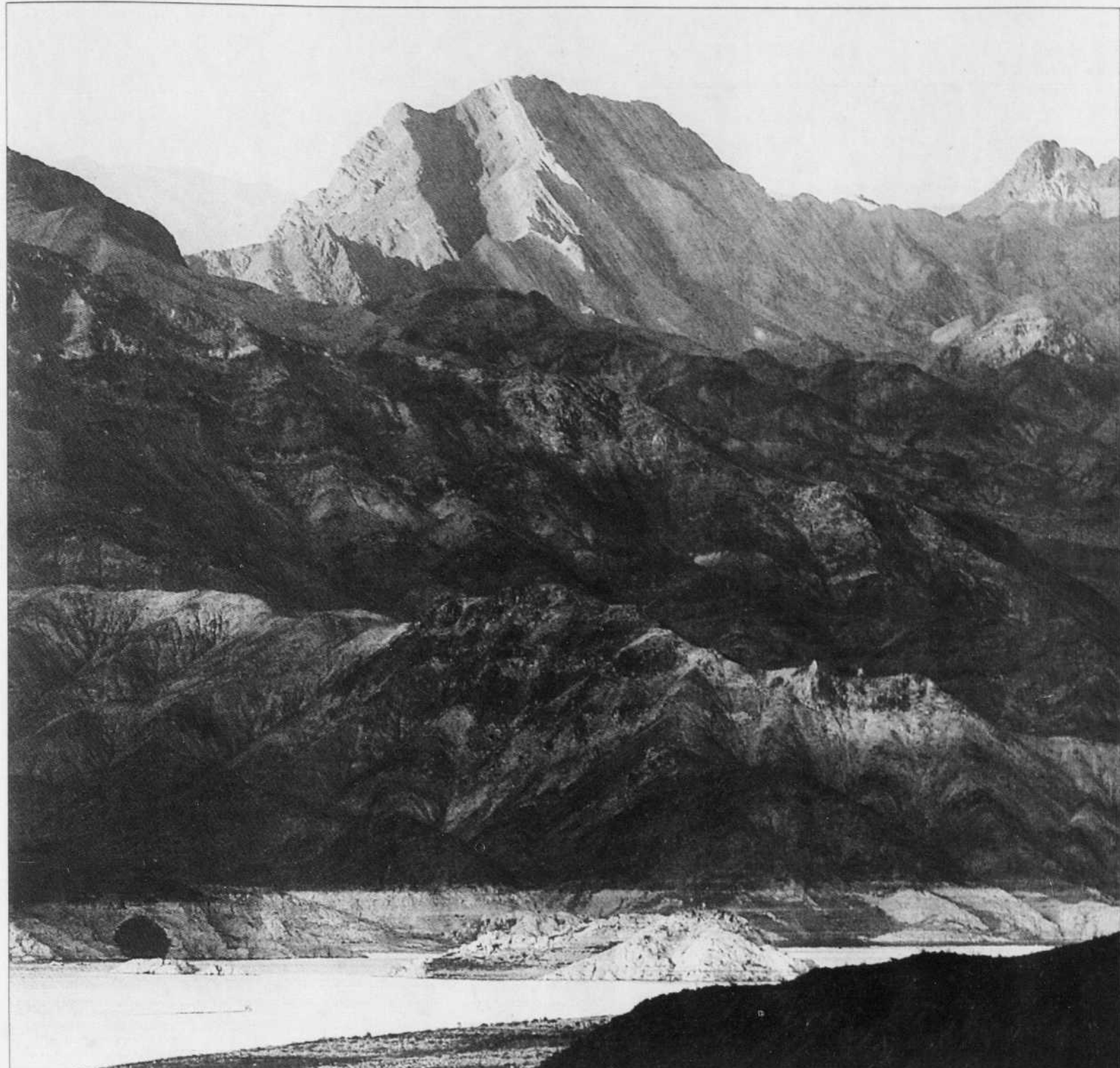
Boulder City, Nevada

Le visage des États-Unis, que l'ensemble du monde appelle l'Amérique, a été fortement mis à mal depuis les célèbres attentats d'il y aura bientôt cinq ans. Mais parce qu'un pays ne se réduit pas à son gouvernement, des intellectuels ont eu envie de témoigner de leur vision de cette Amérique réelle, rêvée, mythique. Le Devoir offrira tous les lundis de l'été de larges extraits de ces regards croisés.