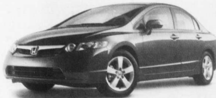
Berline Civic LX illustrée