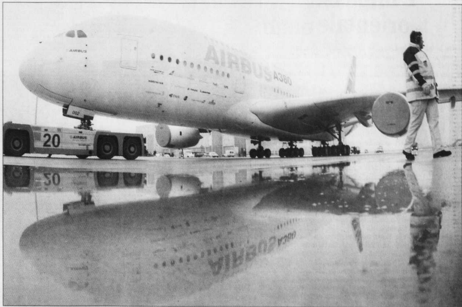
Le Salon de Farnborough, qui devrait revêtir une connotation plus civile que militaire, promet de nouveau un duel de titans entre les deux géants de l'aviation commerciale Airbus et Boeing.