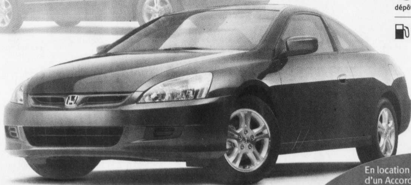
Berline et coupé Accord EX illustrés

En location ou à l'achat d'un Accord coupé > 1500$ en carte d'essence†