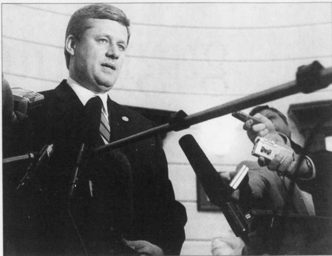
Le premier ministre conservateur Stephen Harper, hier à Saint-Petersbourg