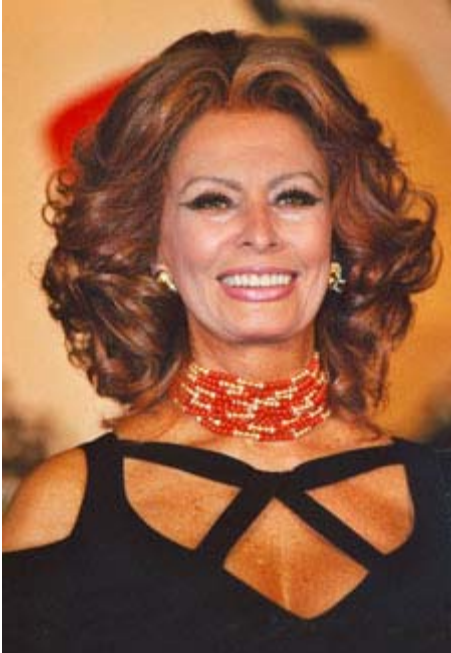
Sophia Loren