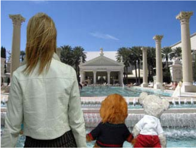
mademoiselle X et les deux mascottes, Monsieur X et sa soeur Miss Gym, en vacances à Las Vegas.

«Ce n'est pas en tournant le dos aux choses qu'on leur fait face.» -Pierre Dac