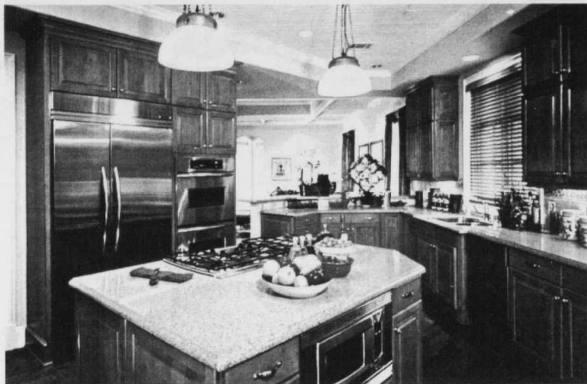
TENDANCE - La cuisine constitue l'un des projets les moins chers et les plus gratifiants. Même les changements mineurs apportés à une cuisine peuvent donner des dividendes à long terme, le rendement sur les investissements en rénovation pour un élément aussi élémentaire qu'un robinet.

En outre, on trouve aussi des finis de robinet blancs, biscuit, lin ou noirs. Ces robinets exigent un minimum d'entretien, mais offrent un superbe impact visuel. Le fini biscuit, pâle et brillant, est par-