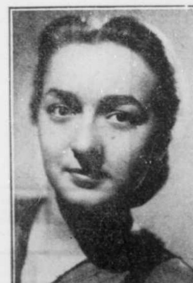
SIMONE LAMARCHE mezzo-soprano (Montréal)