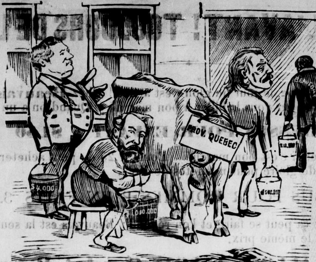
UNE VACHE EN OELLÈRE

SENECAL.—Chapleau et de Beauford ont pris leur traite, cette vache ne peut plus me servir. Elle a eu cinq veaux, ça l'a presque tarie. MOUSSEAU.—J'attends mon tour. Il ne me restera pas grand chose à moi.