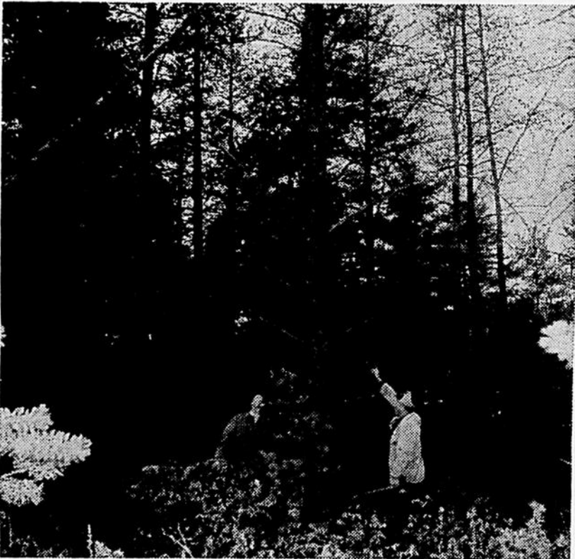
Un instructeur montre à un bûcheron le danger représenté par le chicot sec prêt à lui tomber sur la tête.

C'est la saison de l'année qui présente le plus grand nombre de risques d'accidents pour le travailleur en forêt, a dit Monsieur Bennett. La Mauvaise température est cause de nouveaux dangers à tout moment de la journée et justement parce que cette situation existe, l'attention du travailleur doit être constante.