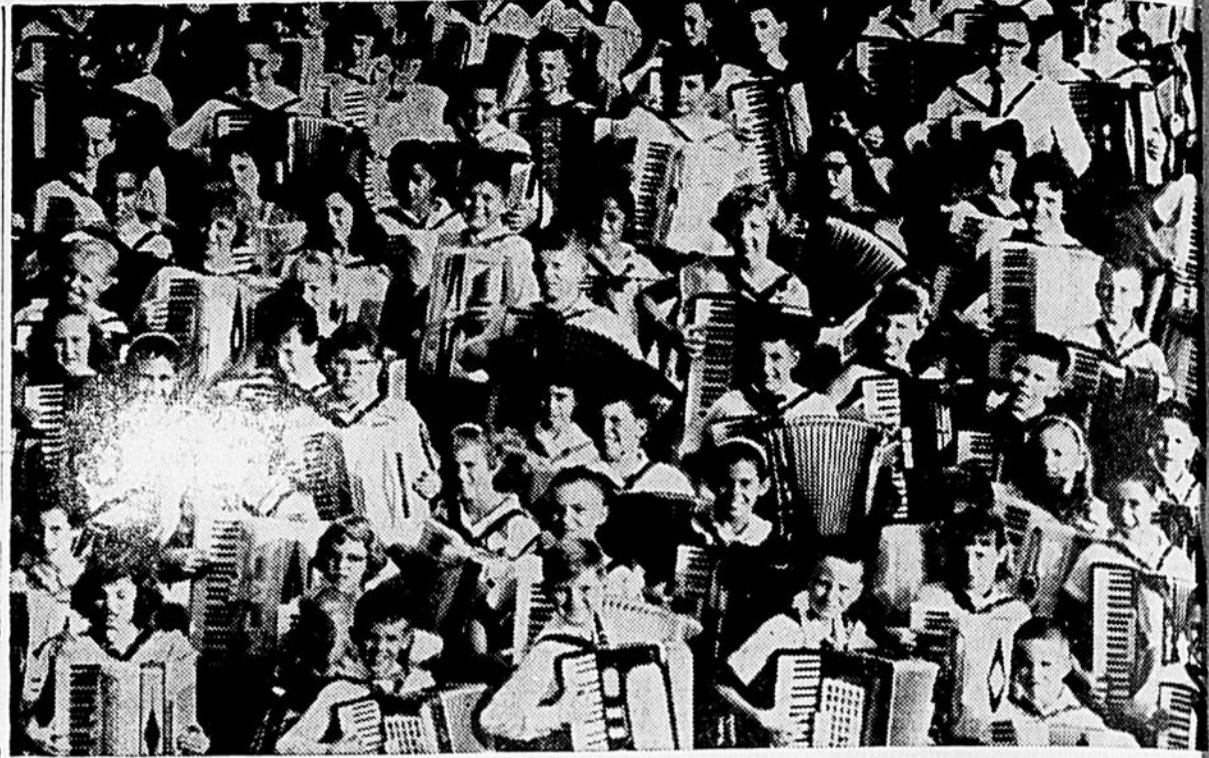
Allez-y, comptez-les! — Cinquante-deux jeunes accordéonnistes figurent sur cette photo, au son de la musique, comme les 200,000 amateurs d'accordéon du Canada jouent avec entrain à l'occasion de la semaine nationale de l'accordéon, du 18 au 25 novembre.

Ces jeunes jouent leur accordéon chaque semaine — non pas seulement une semaine par année — 52 joueurs ardents, très bien adaptés, selon Federfisa de l'industrie de l'accordéon d'Italie.