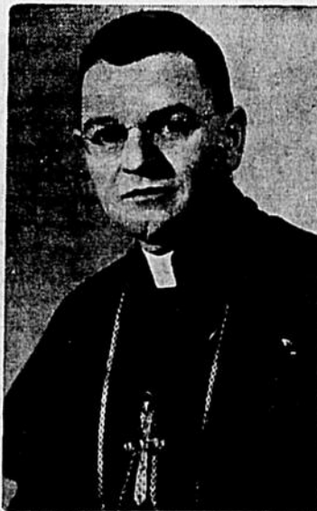
Son Exc. Mgr Georges-Léon Pallatier, évêque de Trois-Rivières, récemment nommé par l'Assemblée Episcopale de la Province civile de Québec, évêque "ponens" auprès de la Société Catholique de la Bible.