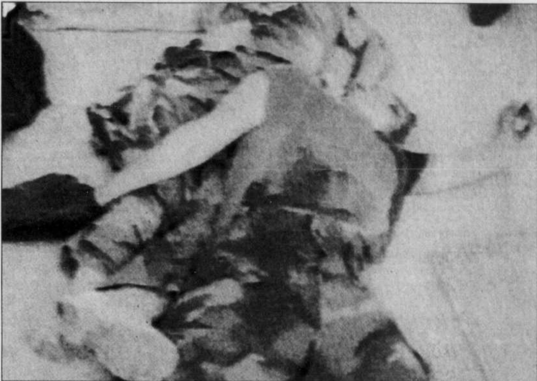
BRIAN MYLES LE DEVOIR

L'armée irakienne a démontré sa capacité de résistance, hier, lors de violents combats dans la région de Nassiriah qui se sont soldés par la capture d'au moins cinq soldats américains et la mort d'une dizaine d'entre eux; des entrevues de Marines hébétés diffusées par la chaîne Al-Jazira, en violation avec la Convention de Genève, ont suscité l'ire du président des États-Unis, George W. Bush, menaçant de poursuivre pour crimes de guerre ceux qui maltraiteraient les prisonniers. La coalition demeure optimiste et satisfaite du déroulement de «l'opération Liberté de l'Irak» et prévoit marcher sur Bagdad, soumise à un déluge de feu, dès demain.