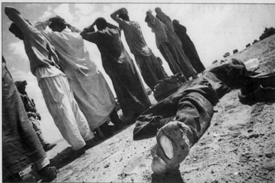
Saddam Hussein tente d'utiliser ses milices comme des combattants de guérilla. Un combat inégal.

Dans l'ouest désertique de l'Irak, connue sous le nom de «zone H», les opérations se poursuivent pour le contrôle de bases aériennes (H2, H3) qui offriraient un «piéd-à-terre» aux Américains dans ce secteur. Le seul à partir les Irakiens pourraient tirer des armes de destruction massive contre Israël.