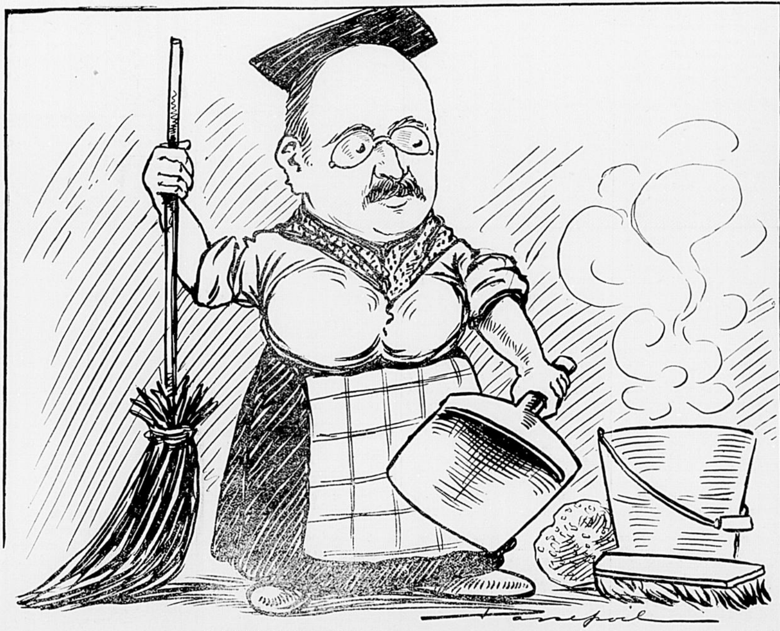
LE JUGE CANNON. — Par où s'en commence ?

ALIRE la Semaine Prochaine: LE HIGH-LIFE "CANAYEN", par Frère SCOPE.