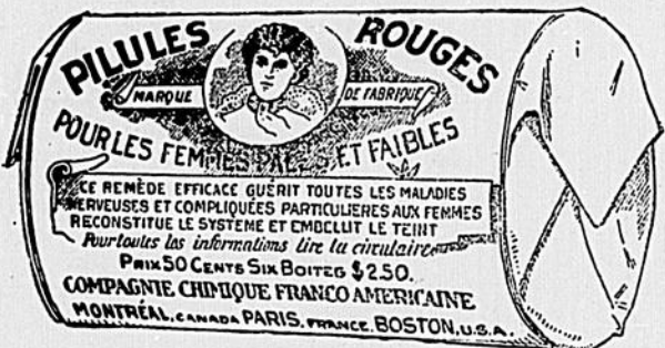
La gravure ici reproduite est un fac-similé d'une boîte de PILULES ROUGES de la CIE CHIMIQUE FRANCO-AMERICAINE.

N'est-ce pas la preuve qu'ils n'ont pas les mêmes effets et que l'un aurait pu être pris à la place de l'autre, ou que pris indifféremment, ils n'auraient pas amené le même résultat. Vous avez dans ces deux tableaux la preuve indiscutable que les maladies de l'homme et celle de la femme exigent chacune leur spécialité.