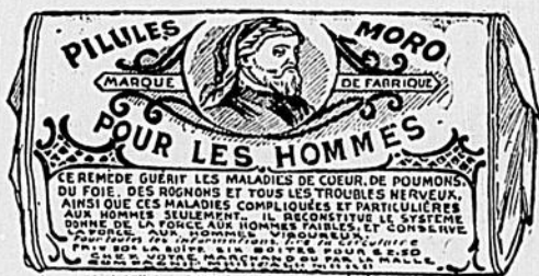
La gravure ici reproduite est un fac-similé d'une boîte de PILULES MORO.

Adressez vos lettres comme suit : CIE CHIMIQUE FRANCO-AMERICAINE, 274 rue St Denis, Montréal.