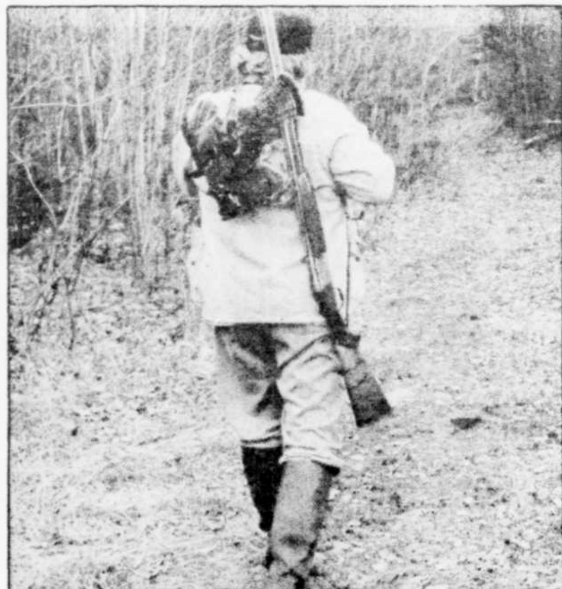
Au Québec, les chasseurs de petits gibiers représentent la moitié des acheteurs de permis de chasse.