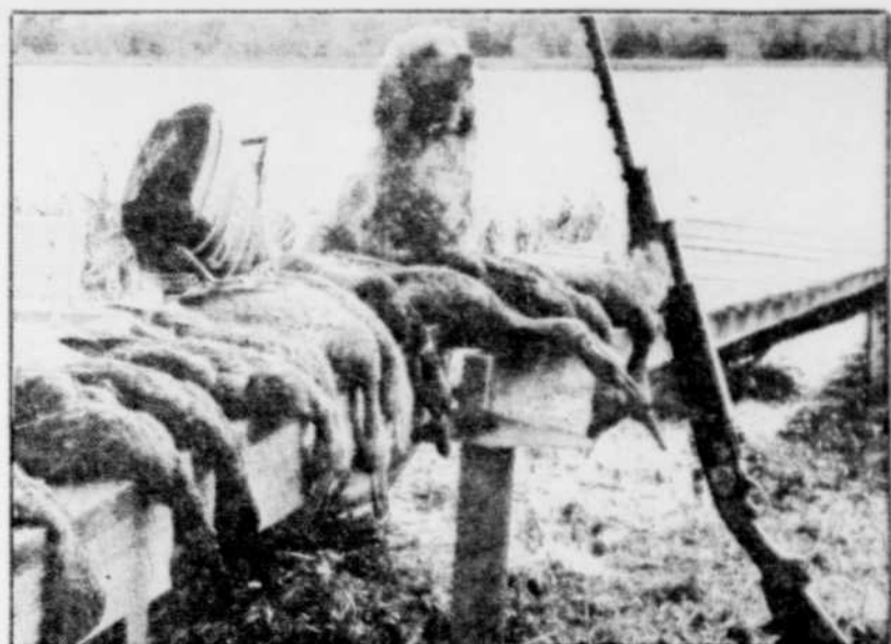
Des oiseaux migrateurs s'empoisonnent au plomb, en ingérant des billes tirées par les chasseurs.

En désirant apporter une solution au problème de l'empoisonnement des migrateurs par les billes de plomb, les gouvernements n'en créent-ils pas d'autres? C'est ce qu'on découvrirait, à compter de 1991 ou de 1992.