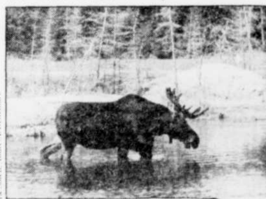
Le Soleil, André-A. Bellemare

R. Simard & Fils PAYEZ-VOUS DU BON TEMPS!