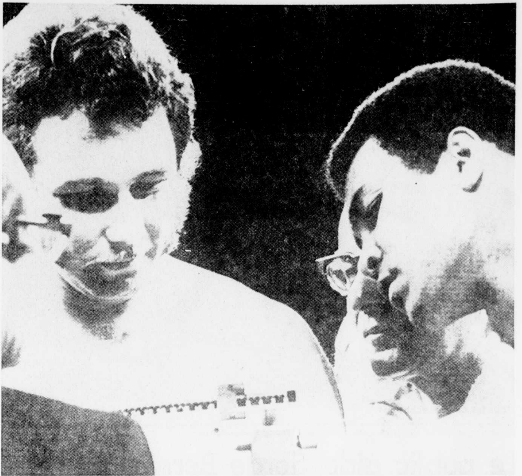
Autre scène de la comédie dont Mohamed Ali et Jean-Pierre Coopman sont les deux vedettes. Hier, c'était la pesée officielle et Ali, à droite, jette un coup d'oeil à la balance sur laquelle est monté Coopman.

Ali en sera à son 52e combat. Il a un palmarès de 49 victoires, dont 35 par KO et deux défaites devant Frazier et Norton. Il a cependant battu Frazier deux fois et a aussi disposé de Norton à une autre reprise.