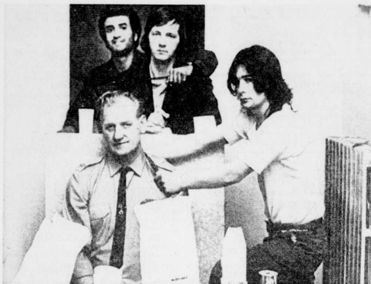
Les prisonniers de New Westminster tenaient des couteaux sur la gorge de leurs otages.