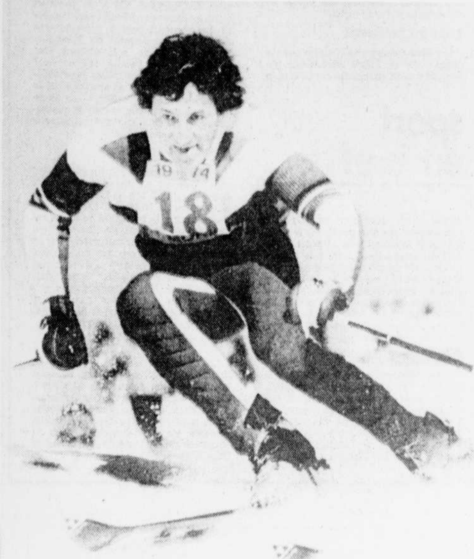
Franz Klammer, l'un des nombreux millionnaires du ski.

C'était le succès de l'industrie scandinave. A Innsbruck, la fibre de verre a remplacé le bois. Le dynamisme et la technologie supérieurs des fabricants de skis alpins se sont imposés. Même les skieurs scandinaves ont eux aussi adopté ce matériel "étranger", et des jours difficiles s'annoncent pour l'industrie du ski scandinave. Le ski de compétition et, à son sommet les Jeux olympiques, n'est plus du tout une petite affaire d'amateurs.