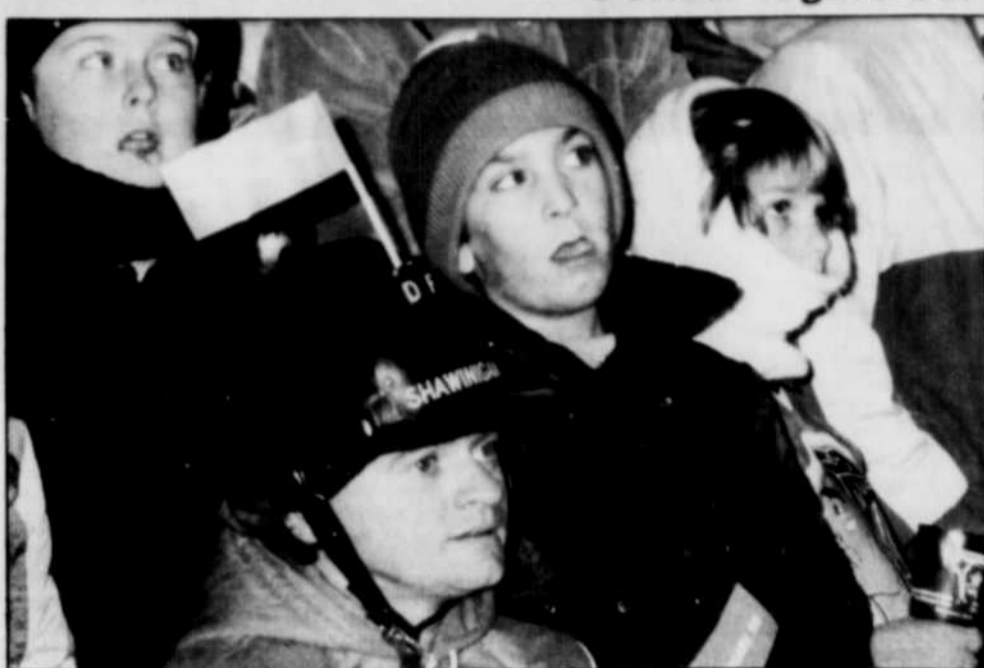
L'histoire ne dit pas si ce "pompiers" est intervenu au moment où l'on a allumé la flamme à Shawinigan. La scène se passait à l'hôtel de ville de Shawinigan, samedi soir.