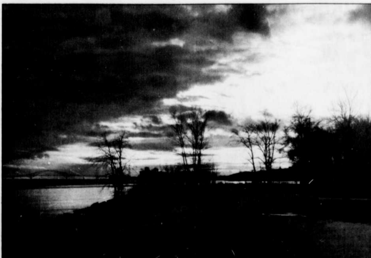
Sous le ciel de Trois-Rivières...

Une fois ces marchés établis, on peut difficilement les abroger d'une part, et d'autre part ces marchés attirent des criminels chevronnés vers le braconnage. Dès lors, la protection du gibier devient difficile, fastidieuse voire dangereuse!