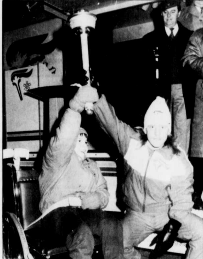
Moment émouvant, quand le porteur de flambeau s'est arrêté devant ce jeune handicapé pour lui permettre de toucher au flambeau. Une belle scène à Shawinigan-Sud.