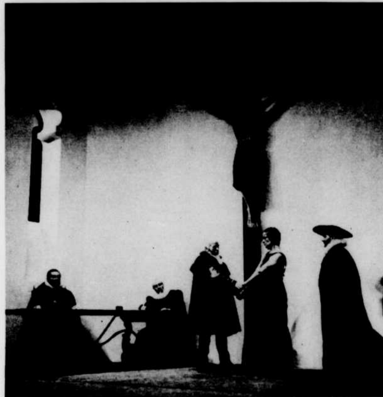
Nous voyons ci-dessus le décor et quelques interprètes de Dulcinée lors de la création de cette pièce à Paris, au Théâtre Montparnasse, en 1938.