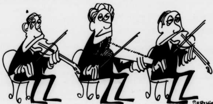
MUSIQUE DE CHAMBRE DIMANCHE 7 h. 30 p.m.