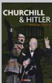
Churchill & Hitler