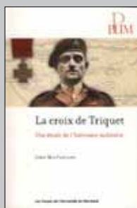
La croix de Triquet