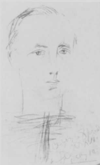
PAUL ELUARD vu par Picasso

Il fut, avec André Breton et Louis Aragon, le fondateur du surréalisme, en 1924. A compter de cette époque, ses recueils réunissent des poèmes assez courts, où le mot est toujours sous-exposé et où la diction n'est jamais grossière au dépens de l'émotion.