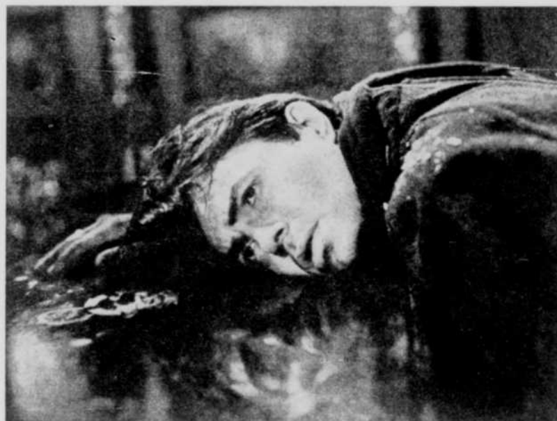
James Mason: ... "victime de l'égoïsme collectif"

On pourra voir un autre film de Reed, le Banni des Iles , mettant en vedette Ralph Richardson et Trevor Howard, samedi soir le 19 juillet, dans le cadre de la série Samedi, 9 heures .