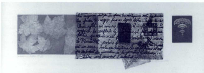
Eau-forte (dyptique) de Suzanne HARNOIS, Phénomènes naturels , 1996.