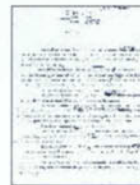
Extrait d' Agaguk , roman d'Yves Thériault. [1958]. Dactylogramme annoté par l'auteur.

Les papiers qu'a légués cet écrivain sont intéressants par plus d'un aspect. La volumineuse documentation qu'il a laissée (sept mètres de documents) concerne bien sûr les nombreux romans qu'il a écrits, dont le plus célèbre demeure Agaguk , mais aussi une quantité impressionnante de contes. C'est d'ailleurs comme conteur que Thériault se définissait. Que ce soit sous forme de recueils ou de courts manuscrits individuels écrits soit à la dactylographie, soit à la main, c'est par plusieurs centaines que l'on dénombre les contes et les nouvelles, dans l'œuvre de Thériault, qui témoignent de sa verve intarissable et de la diversité de ses sources d'inspiration. C'est également par sa correspondance que l'on découvre Yves Thériault, de même que par ses entrevues où il évoque ses débuts difficiles et les embûches auxquelles il a fait face avant de pouvoir gagner sa vie comme écrivain.