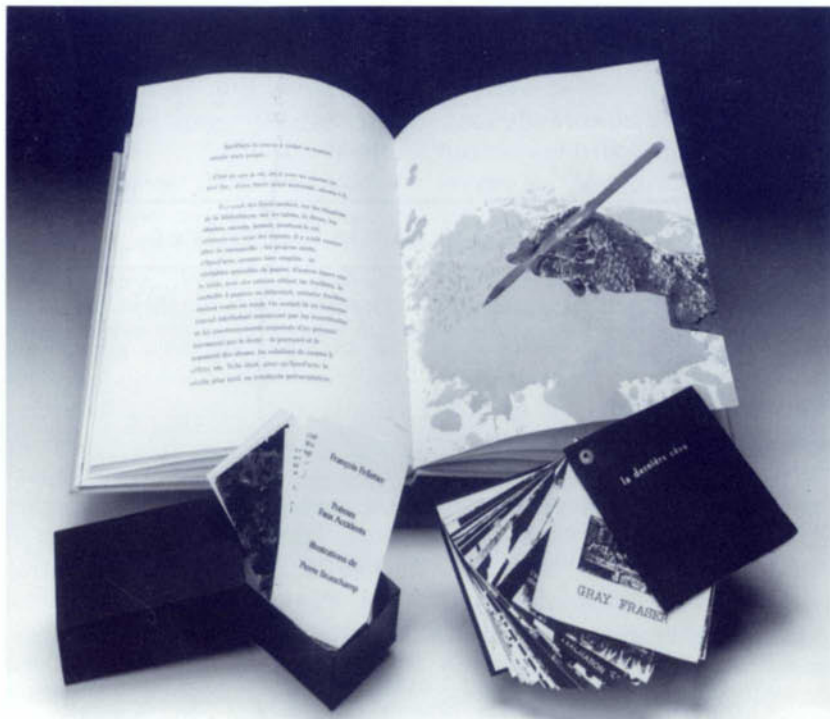
En haut : livre de l'artiste Antoine PENTSCH : T l'Escargot , Éditions du Silence, 1993. À gauche : livre aux dépens de François PELLETIER (poésie) et de Pierre BEAUCHAMP (illustrations) : Poèmes Faux Accidents , 1996. À droite : livre de l'artiste Gray FRASER : La dernière Cène (2 e édition augmentée), 1996.