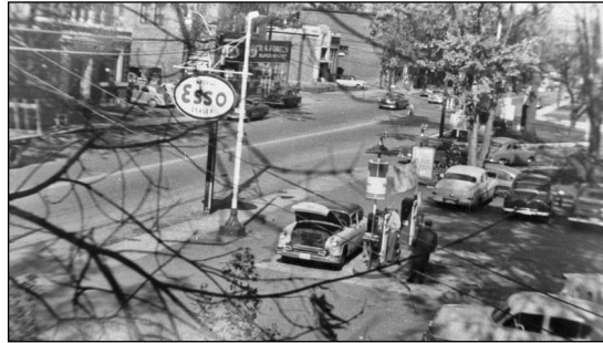
Lennoxville historique : ETRC-P020-79-4-28.jpg Légende : Vue de la rue Queen, Lennoxville, v. 1950.

sélection de photographies, l'exposition offre aux visiteurs un aperçu de Lennoxville à la fin du 19 e siècle et au début du 20 e . On y retrouve des photographies de la rue Queen, de ponts couverts, de la grande place, de la résidence du 88 rue Queen au coin de College ainsi que de plusieurs commerces. L'exposition se tient dans le hall d'entrée de de l'Université Bishop's jusqu'en août 2011.