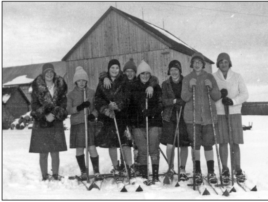
L'hiver dans les Cantons-de-l'Est : ETRC-P170-box 557_4.jpg Légende : Des skieuses de fond à Clifton, v. 1910.

la région. Pour ce faire, nous avons puisé dans les fonds et les collections du CRCE, tels que le fonds Sherbrooke Snow Shoe Club (P150), le fonds Eastern Townships Heritage Foundation (P020), le fonds Sherbrooke Winter Club (P140), la collection de documents iconographiques du CRCE (P998), le fonds Elvyn M. Baldwin family (P173) et (P170).