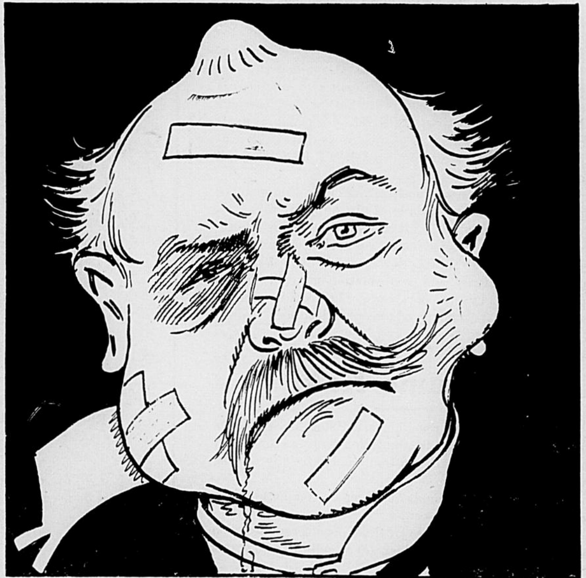
L'homme malade conservateur.